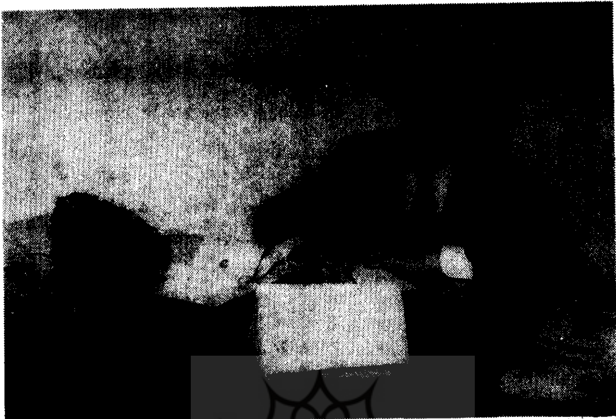
● فریدون مشیری در میانسالی

ترجمان حقیقت پردازد تا بدین وسیله نگارندگان زبردست و ارباب فصاحت و بلاغت را با طرز افکار و سبک تحریر نویسندگان و مؤلفین خارجه تا یک اندازه آشنا سازد...».