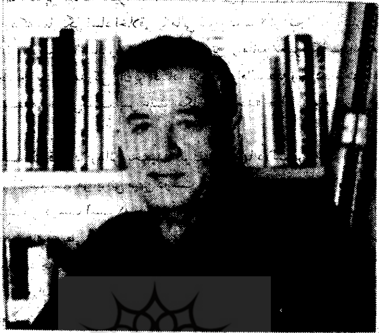
● سیروس غنی