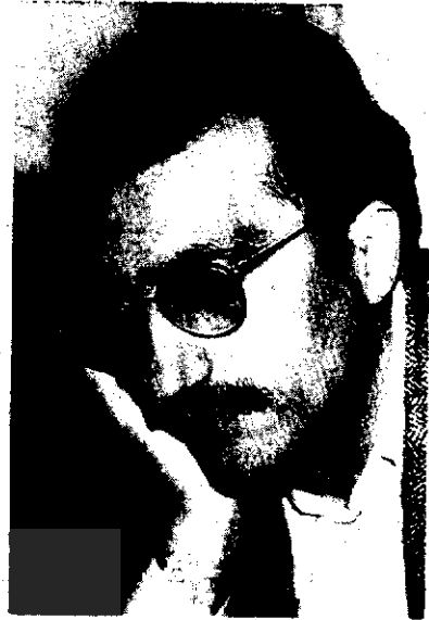
● دکتر عباس میلانی

آقای غنی نشان می‌دهد که از سال ۱۹۱۸ به بعد، یکی از مهمترین اهداف انگلستان در ایران انتصاب و ثوق الدوله به مقام نخست وزیری بود. احمدشاه، چون کاسبی حقیر، با مقامات انگلیسی در این باب چانه می‌زد. می‌گفت به شرطی و ثوق را به صدارت بر خواهد گمارد که دولت انگلیس ماهانه بیست هزار تومان مقرری به وی پرداخت کند. به علاوه، تضمین می‌خواست که در صورت برکناری از پادشاهی، انگلستان ماهی هفتاد و پنج هزار تومان (۲۵ هزار پوند) حقوق تعاعد به او بپردازد (ص ۲۶). سرانجام قرار شد که از اوت ۱۹۱۸، تا زمانی که احمدشاه «وفادارانه از و ثوق الدوله» حمایت کند، ماهانه پانزده هزار تومان از انگلیسیها موجب بگیرد. سفارت انگلیس در عین حال بیست و پنج هزار پوند هم «میان علما و تجار بازار» تقسیم کرد تا آنان را به دفاع از و ثوق الدوله وادارد (ص ۲۷).