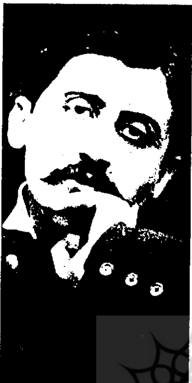
● مارسل پروست

رمان Albertine disparue ۱ داستانی دارد که به نقلش می‌ارزد. این رمان نخست در ۱۹۲۵ به همت روبر پروست پزشک و برادر مارسل با عنوان La fugitive به چاپ رسید تا آنکه ناتالی موریاک، نواده فرانسوا موریاک از جانب پدر و نواده خانم Mante - Proust (برادرزاده مارسل پروست و وارث او) از سوی مادر، متن ماشین‌نویسی شده این رمان را که به دست پروست تصحیح شده بود، تصادفاً در ۱۹۸۶ در صندوقی جزو اموال پروست که به ارث برده بود، یافت و با مطالعه آن دانست که پروست خود، عنوان را به Albertine disparue تغییر داده و ۲۵۰ صفحه نیز از متن اصلی (که در ۱۹۲۵ به چاپ رسیده بود) کاسته است. ناتالی موریاک این متن کوتاه شده را در ۱۹۸۷ به چاپ رسانید.