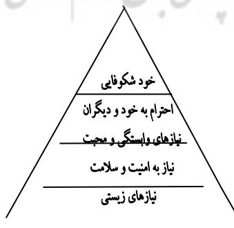
شکل ۱- سلسله مراتب نیازها از نظر مازلو

«مازلو» ۲ سلسله مراتبی از نیازهای افراد را که می‌تواند در درک نیازهای هیجانی و اجتماعی تیزهوشان و مستعدین برای نیل به رشد متناسب مفید باشد را ترسیم کرده است. (شکل شماره ۱) وی پس از «نیازهای زیستی» ۳ (هوا، آب، غذا، پناهگاه و خواب) به دومین سطح از نیازها که همانا «امنیت و سلامت» ۴ است توجه داشته است. سومین مرحله به نیازهای «محبت و تعلق داشتن» ۵ اختصاص دارد و چهارمین سطح نیازها «احساس احترام به خود و احترام به دیگران» ۶ است. «خود شکوفایی» ۷ به عنوان بالاترین سطح شامل رشد تمامی نیازها است.