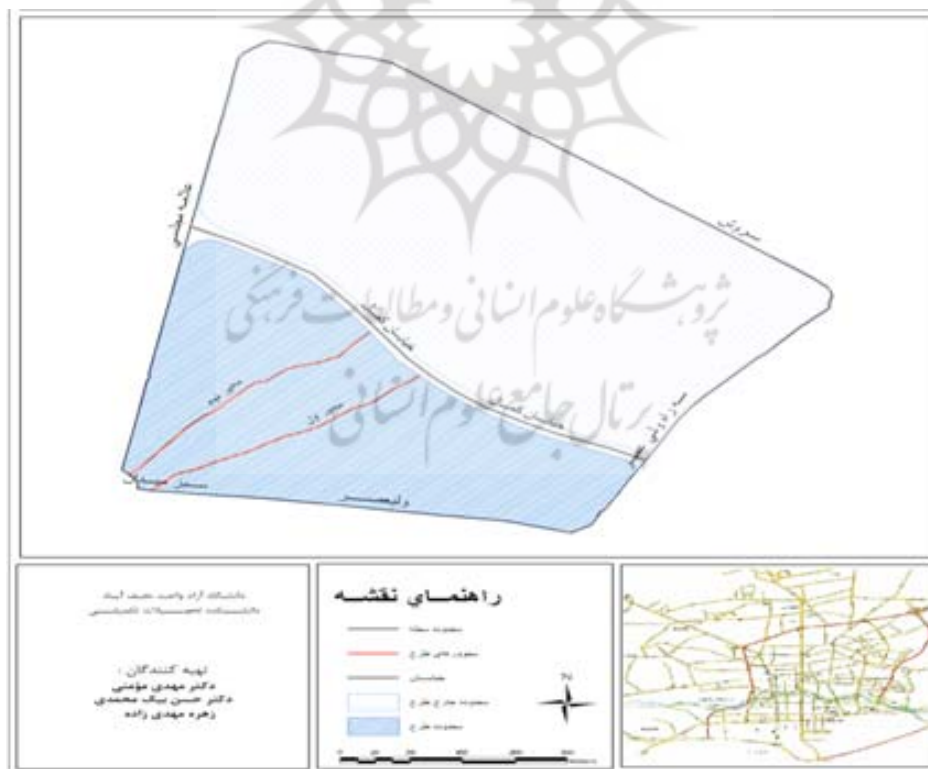
شکل شماره ۲- محدوده اجرای طرح