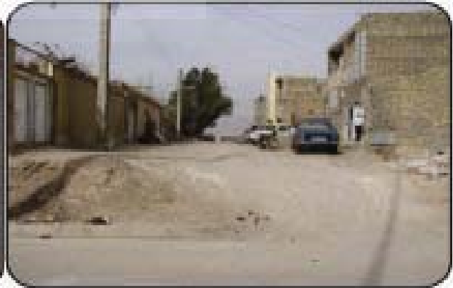
شکل شماره ۳- وضعیت نامناسب دفع فاضلاب و وجود معابر و کوچه های خاکی در محله حسن آباد شهر یزد (اسفند ۱۳۸۷)