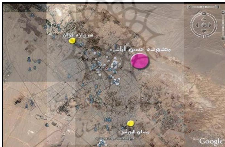
شکل شماره ۱- موقعیت محله حسن‌آباد در ارتباط با شهر یزد (اسفند ۱۳۸۷)

محدوده مکانی پژوهش منطبق بر محدوده محله حسن‌آباد یزد است که تا سال ۱۳۷۰ روستایی کوچک در