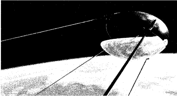
نگاره ۲: نخستین ماهواره‌ی مصنوعی فعال به نام اسپوتنیک - ۱

طبقات فوقانی جو بسیار رقیق است، اما همین مقدار هوای کم نیز برای ماهواره‌ها، در مدارهای پائین و میانی، بسیار مؤثر بوده و نقش عمده‌ای را در طول عمر آنها ایفا می‌کند.