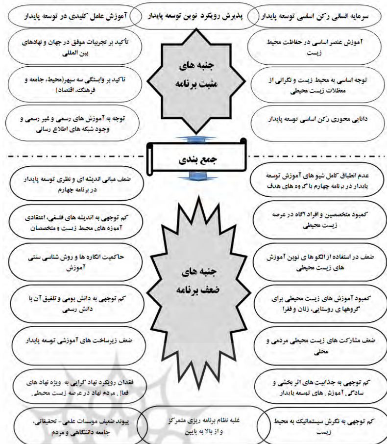
شکل ۳: جنبه های مثبت و منفی برنامه چهارم توسعه ایران بر اساس اهداف دهه ملل (ESD)

بنابراین، نگاهی گذرا به یافته های تحقیق، نشان داد که در محتویات برنامه چهارم حداقل از بعد اندیشه ای، سیاست گذاری و قانون گذاری گام های آرام برای گذار از توسعه کلاسیک به توسعه پایدار شروع شده است. بطوری که تلاش کرده است گزینه های قابل انتخاب برای مردم را در مورد توسعه پایدار و محیط زیست افزایش دهد و با زمینه سازی برای مشارکت و توجه به بخش خصوصی و مدنی در این محورها، برنامه را به برنامه الگوی یادگیری نزدیک سازد و مردم را از گیرنده و دهنده صرف اطلاعات به مشارکت در فرآیند مدیریت و برنامه ریزی فرا خواند. در جهت گیری های کلان و هم در حوزه های بخشی برنامه ریزی برنامه چهارم نیز این حرکت قابل تامل و مشاهده است و اینها نشان از همراهی ج.ا.ا با چالش اساسی جهان در زمینه توسعه پایدار و محیط زیست دارد. اما تا رسیدن به اهداف دهه ESD و تحقق ارزش ها و اصول بنیادین توسعه پایدار گام ها فاصله وجود دارد.