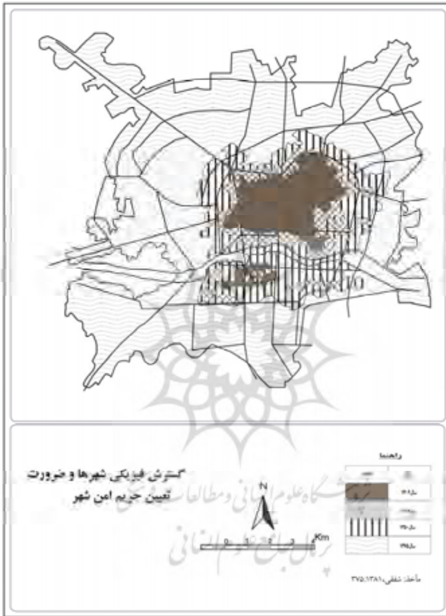
شکل ۲- نقشه ی توسعه فیزیکی شهر طی دوره های مختلف

نقشه ۲- توسعه فیزیکی شهر اصفهان را در هشت دهه گذشته نشان می دهد که بر مبنای عکس های هوایی و نقشه های شهری تهیه گردیده است. در اوایل دوره پهلوی (سال ۱۳۰۲ / ش.) این شهر تنها ۱۵۱۵ هکتار وسعت داشته، در حالی که توسعه فیزیکی آن در سال ۱۳۷۵ / ش، به ۱۷۳۱۸ هکتار افزایش یافته است، یعنی در فاصله حدود ۷۳ سال وسعت شهر ۱۱/۵ برابر گردیده است. مطالعه نقشه بیانگر این واقعیت است که توسعه شهر بین سال های ۱۳۵۰ تا ۱۳۷۵ از رشد شتابانی برخوردار بوده، به طوری که وسعت شهر در این مدت به ۲/۸ برابر رسیده است. بر اساس آخرین نقشه تهیه شده در سال ۱۳۸۲، وسعت شهر به ۱۷۷۸۹ هکتار رسیده است.