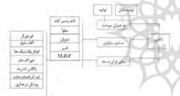
شکل (۵): کاربردهای متنوع باگاس (۶)