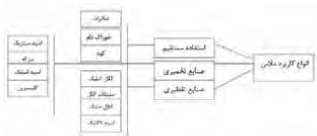
شکل (۴): انواع کاربرد ملاس (۶)