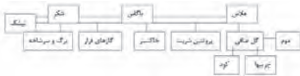
شکل (۳): تولیدات و صنایع جانبی نیشکر (۶)