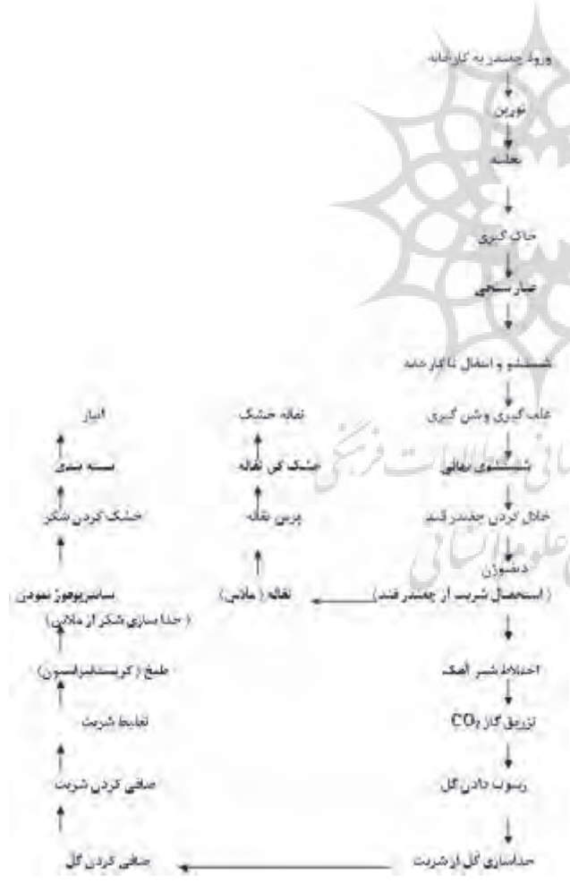
شکل (۱): فرایند تولید قند و شکر (۱۰)

و توسعه پایدار مورد توجه می‌باشد. افزایش بهره‌وری در تولید همواره با کنترل ضایعات، بازیافت و ایجاد ارزش افزوده (بالا بردن ارزش ضایعات) در ارتباط مستقیم بوده و نتایج مثبت حاصل از آن در خصوص کاهش مصرف و جلوگیری از برداشت بی‌رویه منابع محدود، از جمله جنبه‌های پایدار زیست محیطی تلقی گردیده است، لذا استفاده مجدد از زائدات و محصولات جانبی یک صنعت (استفاده از باگاس و ملاس تولیدی در صنعت قند به عنوان ماده اولیه در سایر صنایع نظیر الکل سازی) از جمله راهکارهای اتخاذ شده در جهت کمینه سازی ضایعات در محیط می‌باشد. در راستای عمل به وظیفه خطیر واگذاری محیطی پاک و عاری از آلودگی به نسلهای آتی که بر طبق اصل پنجاهم قانون اساسی حق مسلم آیندگان می‌باشد. تحلیل معضلات ناشی از تخلیه فاضلاب صنایع قند در محیط و تشریح وضعیت موجود و بیان راهکارهای مناسب جهت کاهش آلودگی ناشی از پساب این صنایع در سطوح مختلف ملی و بین المللی از اهمیت قابل توجهی برخوردار است [۱۲].