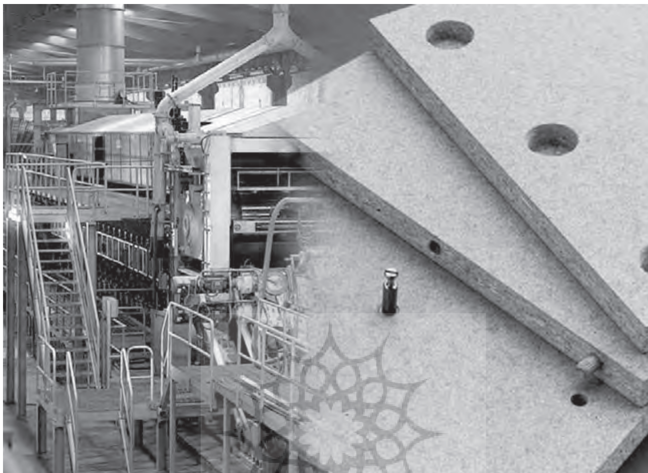
جدول (۲): میزان و درصد تولید صنایع قند و شکر کشور (۱)