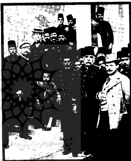
عشائی در اوایل قرن بیستم

فکر می کنم اگر سلطنت منور هم جایگزین سلطنت مطلقه می شد امکان داشت میرزا آقاخان کرمانی با آن راه بیاید ولی در نهایت او دنبال اصلاحات و ایجاد نظام مشروطیت بود. یعنی بیشتر دنبال نظامی بود که مردم در آن مشارکت داشته باشند. من فکر می کنم اگر خود شاه یعنی نظام استبدادی شاه هم عدالت خواه بود و قانون محور، احتمالش بود که میرزا آقاخان کرمانی از آن حمایت کند ولی میرزا آقاخان کرمانی