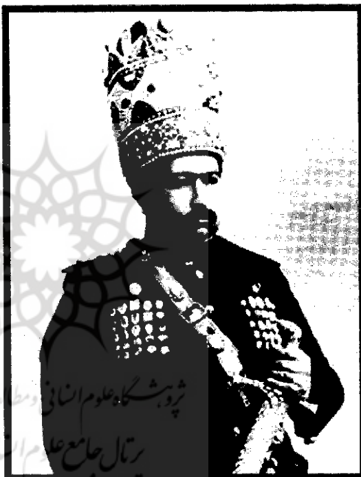
محمدعلی شاه قاجار

برای اینکه سیدجمال، خیلی خشن رفتار می‌کرد و خیلی به ناصرالدین‌شاه اهانت می‌کرد. جرات زیادی هم داشت که این کارها را انجام بدهد. در عین