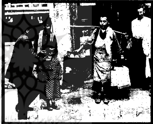
خدمت‌های در اوایل قرن بیستم

توضیح می‌دهد که اگر یک نفر با خود رأیی بر جامعه حکم براند استبداد شکل می‌گیرد؟