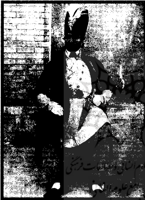
ناصرالدین شاه در دوره جوانی

به نظر شما موضوع اطلاعات کسب کردن از این نشریه فارسی زبان مطرح نبوده است؟ آخر مگر این نشریه فارسی زبان چه داشت. بیشتر مطالب این نشریه فارسی زبان عمدتاً اطلاعات اروپا را منعکس می‌کرد و عمدتاً مسائلی را مطرح می‌کرد که برای ایرانیان جدید بود. مطالب اختر هم از مطبوعات اروپا و مطبوعات عثمانی گرفته شده بود.