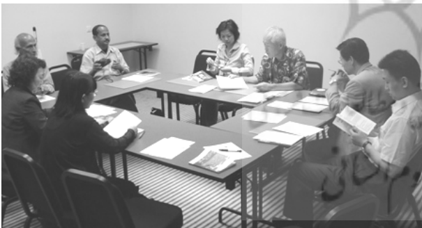
نشست کمیته‌ی آسیایی انجمن جهانی اسپرانتو