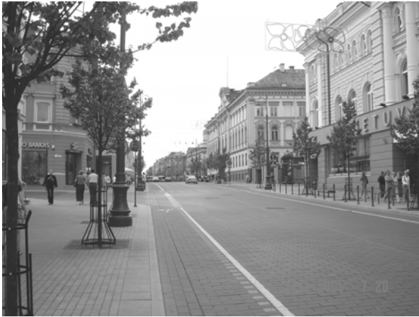
یکی از خیابان‌های معروف ویلنیوس