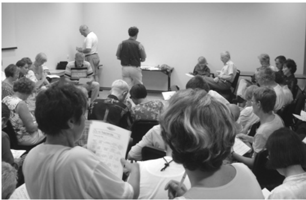
کلاس آموزش برای نوآموزان