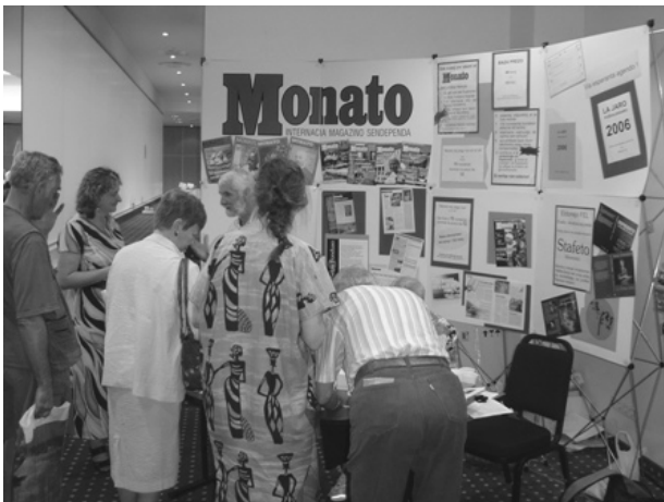
غرفه‌ی مجله‌ی موناتو

اسپرانتو پذیرفته شد و بدین ترتیب ارتباط منطقی ما با جهان اسپرانتو برقرار شد. یکی از انگیزه‌های من برای شرکت در کنگره‌ی جهانی در واقع همین پذیرش انجمن ما بود و خوشحالم که سرانجام توانستیم کاری را که باید خیلی پیش از این‌ها و ماها! انجام می‌شد، انجام دهیم. امروز آخرین فرصت خرید کتاب نیز هست و من از این فرصت استفاده کرده و مقداری از کتاب‌های مورد نیازم را خریداری کردم. در نمایشگاه و فروشگاه کتاب چند نویسنده‌ی مطرح نیز حضور داشتند و با علاقه‌مندان آثار خود گرم گفت و گو بودند ... امشب ساعت ۲۰ برنامه‌ی "عصر بین‌المللی هنر" تدارک دیده شده است. در مدت کنگره کسانی که هنری دارند و مایل به معرفی آن هستند ثبت نام می‌کنند و در چنین شبی گروه‌های بین‌المللی اقدام به معرفی هنر خود می‌کنند که شامل آواز، موسیقی، نمایش، شعرخوانی، داستان خوانی و رقص است. "بین‌المللی بودن" ویژگی این برنامه‌ها است. درحالی که یک روسی پیانو می‌نوازد آوازه‌خوان ارمنی آواز می‌خواند و یا گروه ۵ نفری از ۵ کشور نمایشی را اجرا می‌کنند و .... برنامه‌ها خیلی گیرا و زیبا بودند و من متأسف بودم که جای اسپرانتیست‌های هنرمند ایرانی در این شب خیلی خالی بود.