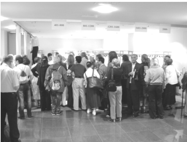
روز اول کنگره / دریافت کارت و کتاب

امروز بیشتر برنامه‌ها حول محور جنبش اسپرانتو است. "دفتر مرکزی سازمان جهانی پاسخ می‌هد" اولین برنامه‌ای است که در آن شرکت می‌کنم. "فعالیت‌های کشوری" برنامه‌ای دیگر است که در آن