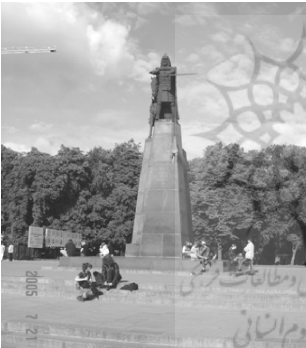
پیکره‌ای به یادبود بنیانگذار شهر

بعد از ظهر حداقل ۲۵ سخنرانی و برنامه هست که هم زمان نمی توان در همه ی آن‌ها شرکت کرد! پس باید بهترین‌ها را بنا به علاقه و شدت گرایش انتخاب نمود من هم به سخنرانی پرفسور تونکین می روم که به موضوع اصلی امسال کنگره اختصاص دارد: "کنگره‌های جهانی، سد سال ارتباط و داد و ستد فرهنگی". عصر، برنامه‌ی "شب ملی" از ساعت ۲۰ تا ۲۲ در استادیوم سیه مهناس آرنا برگزار می شود و تقریباً همه ی شرکت کنندگان در کنگره با اشتیاق می آیند چون برنامه‌ی "شب ملی" یکی از بهترین بخش‌های هر کنگره‌ی جهانی اسپرانتو تلقی می شود. در این برنامه کشور میزبان داشته‌های فرهنگی خود را به شرکت کنندگان در کنگره نشان می دهد. برنامه شامل بخش‌هایی از معرفی فرهنگ روستایی، رقص، آواز و سازهای موسیقی لیتوانی بود که هنرمندان برجسته‌ی لیتوانیایی به شایستگی اجرا کردند و در پایان با تشویق گرم شرکت کنندگان بدرقه شدند.