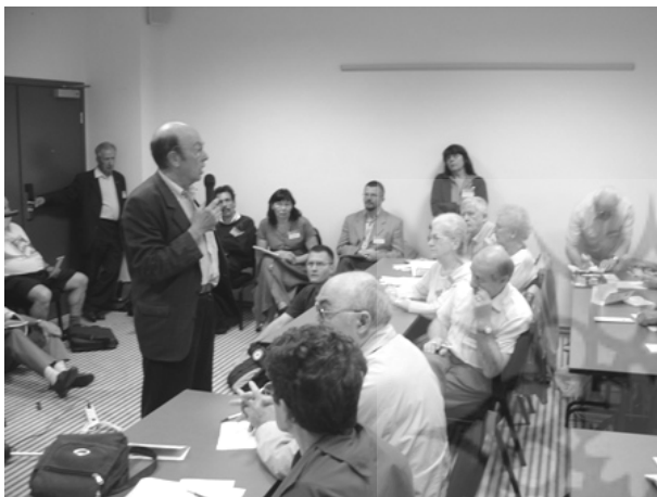
نشست اتحادیه آموزگاران اسپرانتو