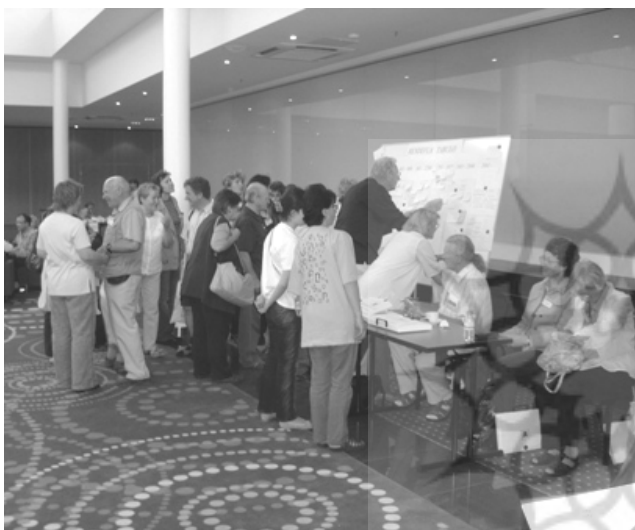
تابلو اعلانات شرکت کنندگان