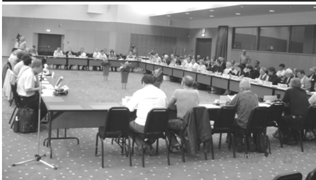
نشست کمیته‌ی مرکزی