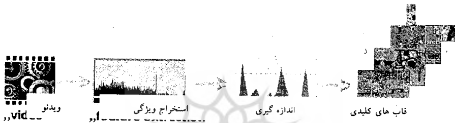
شکل ۲. تجزیه ویدئو به قاب‌های کلیدی

۲. انتخاب مهم‌ترین قاب از طریق کاهش قاب‌های زائد یا دسته‌بندی قاب‌ها بر اساس میزان ربط. شکل ۲ تجزیه ویدئو به قاب‌های کلیدی را نشان می‌دهد.