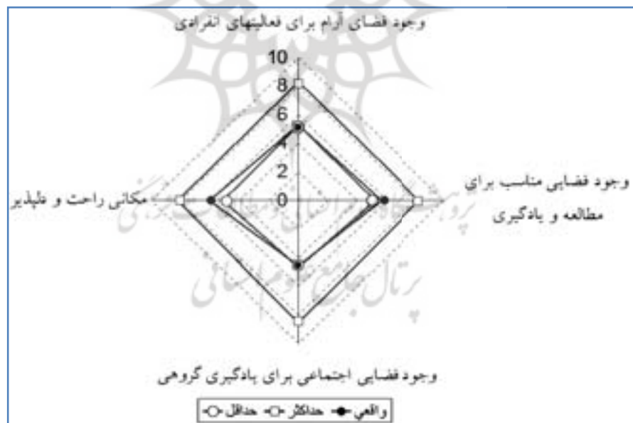
نمودار ۳. مقایسه فواصل بین سطوح حداقل حداکثر و واقعی در مورد کیفیت فضای کتابخانه