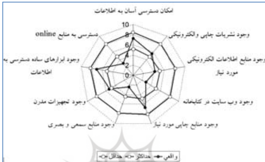
نمودار ۲. مقایسه فواصل بین سطوح حداقل، حداکثر و واقعی در مورد کیفیت منابع کتابخانه