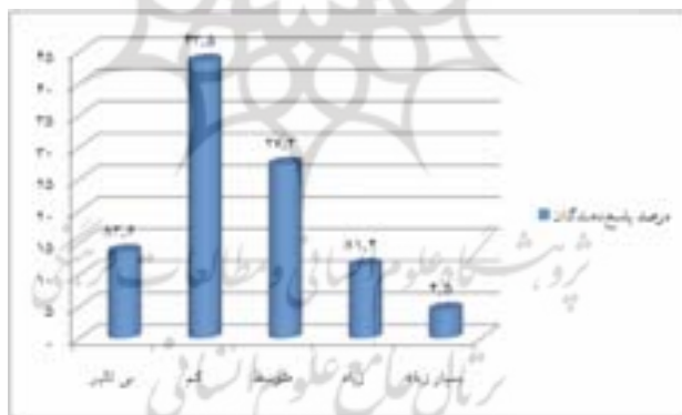
نمودار ۳. درصد تاثیر برنامه‌های آموزشی غیررسمی کانون بر توانایی دانش‌آموزان در نقد و پالایش منابع اطلاعاتی

بررسی نمودار ۳ بیانگر این امر است که ۱۳/۶ درصد از پاسخ دهندگان معتقدند که آموزشهای غیررسمی کانون موجب افزایش توانایی دانش‌آموزان در نقد و پالایش منابع اطلاعاتی نمی‌شود. ۴۳/۵ درصد از پاسخ دهندگان در این مورد، تاثیر آموزشهای غیررسمی کانون را کم، ۲۷/۳ درصد متوسط، ۱۱/۴ درصد زیاد و ۴/۵ درصد بسیار زیاد دانسته‌اند.