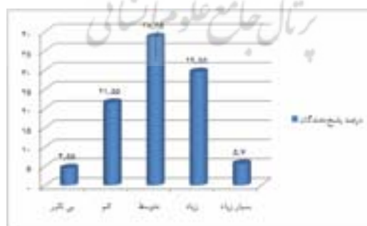
نمودار ۴ - درصد تاثیر برنامه‌های آموزشی غیررسمی کانون بر توانایی تفکر انتقادی و خلاق دانش آموزان

۶. توزیع فراوانی و درصد تاثیر برنامه‌های آموزشی غیررسمی کانون بر توانایی تفکر انتقادی و خلاق دانش آموزان چقدر است؟