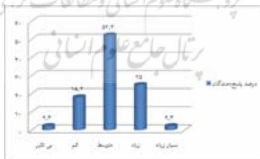
نمودار ۱- درصد تاثیر برنامه‌های آموزشی غیررسمی کانون بر ایجاد حس کنجکاوی و روحیه پرسشگری

ارقام نمودار ۱ که حاصل نظرات کتابداران و آموزگاران می‌باشد، نشان می‌دهد که ۲/۳ درصد از پاسخ دهندگان بر این باورند که طرح خودگردان بر ایجاد حس کنجکاوی و روحیه پرسشگری دانش‌آموزان تاثیری ندارد، همچنین ۱۸/۲ درصد از پاسخ دهندگان تاثیر این برنامه‌ها را کم، ۵۲/۳ درصد متوسط، ۲۵ درصد زیاد و ۲/۳ درصد بسیار زیاد می‌دانند.