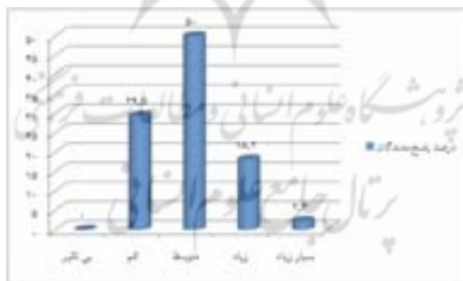
نمودار ۶ - تاثیر برنامه‌های آموزشی غیررسمی کانون بر میزان استفاده دانش آموزان از انواع منابع اطلاعاتی

۹. توزیع فراوانی و درصد تاثیر برنامه‌های آموزشی غیررسمی کانون بر میزان استفاده دانش آموزان از انواع منابع اطلاعاتی چقدر است؟ داده‌های حاصل از نمودار ۶ نشان می‌دهد که همه پاسخ دهندگان بر این باورند که برنامه‌های آموزشی غیررسمی کانون بر میزان استفاده دانش آموزان از انواع منابع اطلاعاتی موثر است. البته ۲۹/۵ درصد از آموزگاران و کتابداران میزان تاثیر را کم، ۵۰ درصد متوسط، ۱۸/۲ درصد زیاد و ۲/۳ درصد بسیار زیاد دانسته‌اند