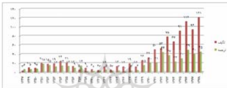
نمودار شماره ۱. روند تألیف و ترجمه در مجلات در طی سالهای ۱۳۴۷-۱۳۷۸

نگاهی به نمودار ۲ نشان می‌دهد که این نمودار تابعی از نمودار ۱ می‌باشد. به عبارت دیگر می‌توان گفت که سهم مشارکت زنان در پدید آوردن مقالات کتابداری و اطلاع‌رسانی در طی این دوره ۳۰ ساله تابعی از وضعیت کلی مقالات منتشر شده در این حوزه در طی سال‌های مورد بررسی و تغییرات این انتشارات است. به نظر می‌آید همان عواملی که بر انتشار آثار مردان در حوزه کتابداری و اطلاع‌رسانی تأثیرگذار بوده، بر انتشار آثار توسط زنان نیز مؤثر بوده است. نمودار ۲ نشان می‌دهد که انتشار مقالات توسط زنان نیز، همانند نمودار ۱، از سه دوره مشخص (دو دوره شکوفایی و افزایش انتشارات و یک دوره افول و کاهش انتشارات) تبعیت می‌کند.