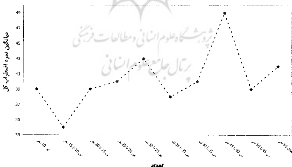
نمودار ۲: مقایسه میانگین نمرات اضطراب جسمی به تفکیک تعداد دانش‌آموزان

با استفاده از آزمون پیرسون (جدول ۲) مشخص گردید که بین سن پدر با اضطراب امتحان جسمی ( P = ۰/۹۹ ، r < ۰/۰۱ )، اضطراب امتحان شناختی ( P = ۰/۴۹ ، r = -۰/۰۳ ) و اضطراب کل ( P = ۰/۷۶ ، r = -۰/۰۳ ) ارتباط معنی‌داری وجود ندارد. آزمون پیرسون برای بررسی ارتباط بین اضطراب امتحان و سن مادر استفاده گردید و مشاهده شد که ارتباط بین سن مادر و اضطراب جسمی ( P = ۰/۱۹ ، r = -۰/۰۶ ) و اضطراب امتحان شناختی ( P = ۰/۳۳ ، r = -۰/۰۴ ) و اضطراب امتحان کل ( P = ۰/۲۴ ، r = -۰/۰۵ ) معنی‌دار نمی‌باشد، ولی چنان‌که ملاحظه می‌شود همبستگی ضعیف و