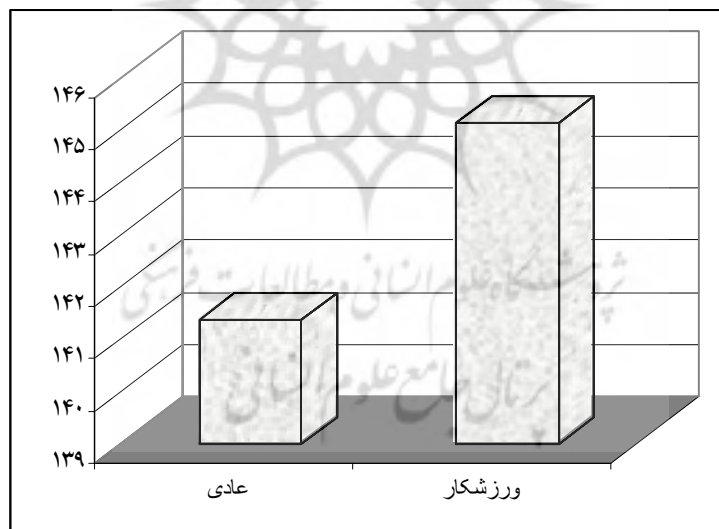
شکل ۲- مقایسه میانگین نمره رضایت زناشویی در دو گروه

براساس یافته‌های جدول ۵، ارتباط بین سابقه فعالیت ورزشی، تعداد فرزندان و مدرک تحصیلی با رضایت زناشویی ورزشکاران، در سطح P < 0/05 معنادار نبوده است. همچنین ضریب همبستگی چندگانه بین ویژگی‌های