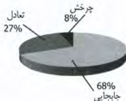
نمودار ۵. درصد توزیع ویژگی‌های مهارت‌های پایه

از لحاظ توزیع ویژگی‌های مهارت‌های پایه: جابه‌جایی ۶۸٪، تعادل ۲۷٪ و چرخش ۵٪ (نمودار ۵) و از جهت انواع مهارت‌های پایه: دویدن ۴۲٪، پریدن ۱۶٪، یک پا ایستادن ۸٪، سر خوردن ۶٪، ضربه زدن ۸٪، راه رفتن ۱۴٪ و پرتاب کردن ۶٪ (نمودار ۶) رابه خود اختصاص داده است.