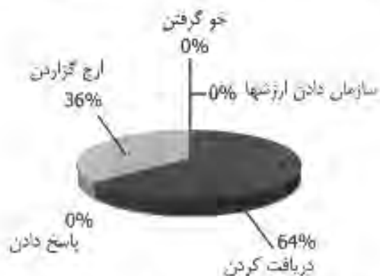
نمودار ۳. درصد توزیع مشخصه‌های تصویری در حیطه عاطفی