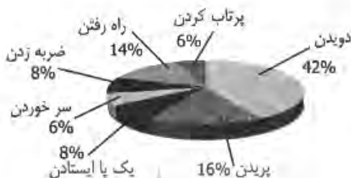
لمودار ۶، برحسب توزیع ویژگی‌های انواع مهارت‌های پایه