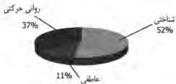
نمودار ۱. درصد توزیع انواع حیطه‌ها