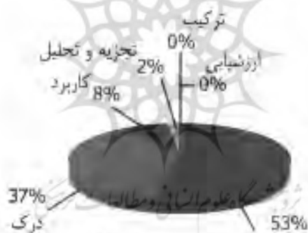
نمودار ۲. درصد توزیع مشخصه‌های تصویری در حیطه شناختی