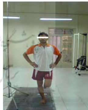
شکل ۱. پروتکل پرش- فرود: از بالا قبل از پرش، حین پرش، و هنگام فرود