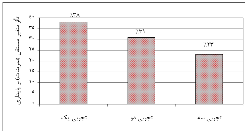
نمودار ۲. میزان تأثیر متغیر مستقل (تمرینات قدرتی) بر روی پایداری آزمودنی‌ها