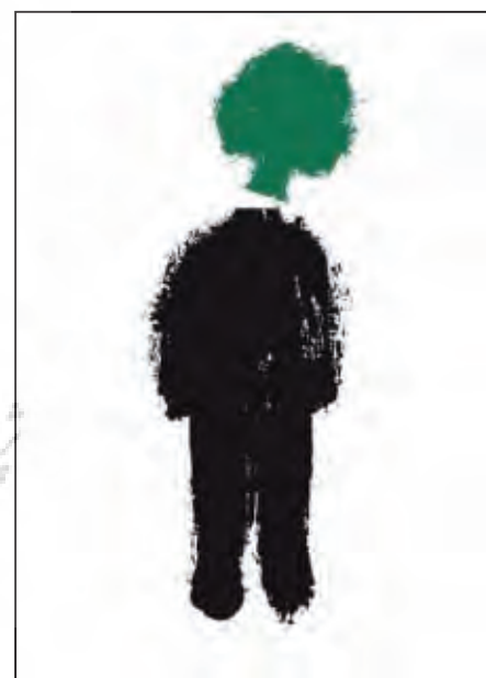
چاپ دو رنگ در کاری از courtois

پوستر Clande Kuha در سه رنگ Spot، سبز، مشکی و فلورسنت ارائه شده است. کارهای آقای Yang Liu نیز شامل یک مجموعه از پوسترهای دو رنگ می‌باشد. Holger Mathies با چند کار زیبا که یکی از آنها کار با حروف یا به عبارتی تایپوگرافی است حضور دارد. تایپوگرافی ارائه شده بر روی کاغذ گلاسه سفید با دو رنگ قرمز و مشکی به همراه یک دایره طلاکوب شده در نمایشگاه خودنمایی می‌کند. پوسترهای ساده و زیبای Oleksakr Mikula با دو رنگ قرمز و مشکی در کنار هم قرار دارد.