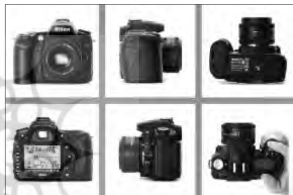
مجموعه کامل است.

۱. عکاس می خواهد جنبه های مختلف یک موضوع را به بیننده نشان دهد، مثلا می خواهد ساختمان و شکل ظاهری مدل معینی از یک دوربین عکاسی را به بیننده نشان دهد. در چنین مجموعه ای توالی و پیاپی بودن عکس ها مطرح نیست. مهم ترین مسئله نشان دادن تمامی وجوه دوربین است. یک دوربین عکاسی شش وجه دارد بنابراین نشان دادن همه وجوه ضرورت دارد و اگر وجهی از قلم بیفتد مجموعه ناقص خواهد بود. یا اگر به جای نشان دادن یکی از وجه های بدنه، عکاس سراغ بخش کوچکی از دوربین برود، راه را به خطا رفته است.