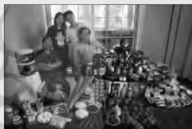
چین: خانواده درنگ، بکن مصرف هفتگی: ۶۰،۱۵۵ دلار غذاهای مورد علاقه: کباب گوشت خوک، باسنی ترش و شیرین