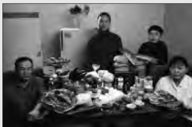
مکزیک: خانواده باسوری، اولان باتور مصرف هفتگی: ۴۰۰ دلار غذاهای مورد علاقه: کوفته