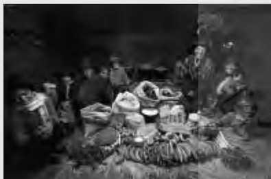
اکوادور: خانواده اسپچه، نینکو مصرف هفتگی: ۳۱,۵۵۵ دلار غذاهای مورد علاقه: سوپ سیب زمینی و کلم

او به بیش از ۸۰ کشور جهان سفر کرده و خانواده ای را انتخاب کرده و مصرف غذایی آن خانواده را در یک هفته نشان داده است. کار او صرفا به عکس خلاصه نشده و اطلاعات سودمندی را در زیر نویس به خواننده ارائه می کند.