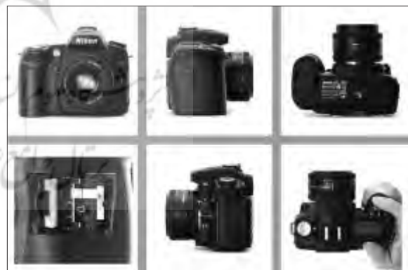
مجموعه ایراد دارد. عکاس به جای نشان دادن پشت دوربین به جزئیات (محفظه ی کارت حافظه) پرداخته است.

در مثال دوربین عکاسی تقریبا این بحث برای خوانندگان کاملا روشن است اما اگر قصد مثلا نشان دادن یک بنای قدیمی باشد موضوع اندکی پیچیده تر می شود. این که برای معرفی بنای قدیمی یاد شده چه وجوهی از ساختمان را باید نشان داد.