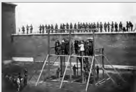
هرولد آرودت، باین و طنابسوزات را پس از خواندن حکم و انداختن طناب بر گردنشان، اعدام می کنند. واشنگتن، ۷ ژوئیه ۱۸۶۵