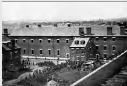
هرولد، آزرودت، پاین و خانم سورات را پس از خواندن حکم و انداختن طناب برگردنشان، اعدام می کنند واشنگتن، ۷ ژوئیه ۱۸۶۵