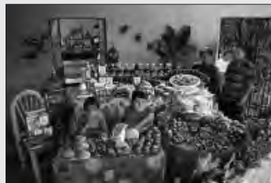
مکزیک: خانواده کالاس، کوزاواکا مصرف هفتگی: ۸۸،۰۰۹ دلار غذاهای مورد علاقه: پیتزا، خرنچنگ، ماکارونی، جوجه