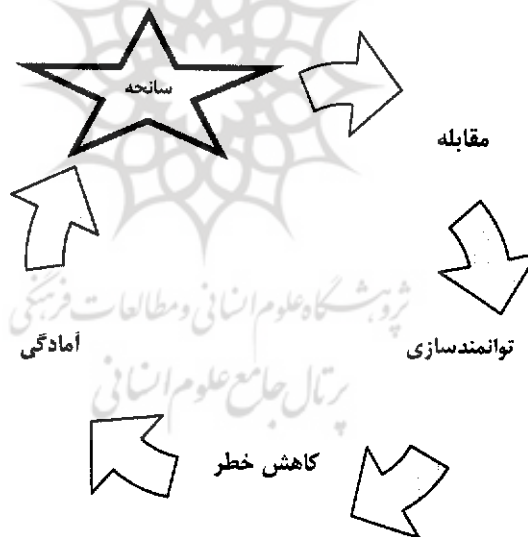
شکل ۲: موقعیت سیستم‌های پیش‌بینی و هشدار سیل در مدیریت