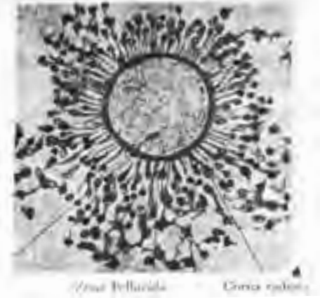
شکل شماره ۲- سازمان سلولی اوول

تخم، سلولی است که در ابتدا از سایر سلولها متمایز است. قطر آن ابتدا ۰/۳ میلی متر است و به تدریج به علت افزایش سیتوپلاسم بزرگ می شود. سلول تخم دارای هسته و سیتوپلاسم می باشد. غشای سلولی، پرده ویتلین نامیده می شود و در خارج آن ورقه ضخیم تری وجود دارد که از جنس گلیکوپروتئین است و از سلولهای تغذیه کننده به وجود آمده و در مجموع، منطقه پلوسید ۱ نامیده می شود. منطقه پلوسید نیز از دو سه طبقه سلول احاطه شده است که به طور شعاعی قرار دارند. این منطقه «corona radiate» نامیده می شود. (شکل شماره ۲)