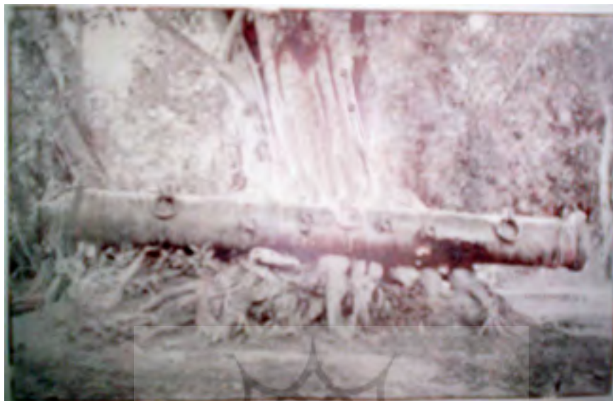
عکس از کتاب مسند مرشدآباد (۱۹۰۴-۱۷۰۴)