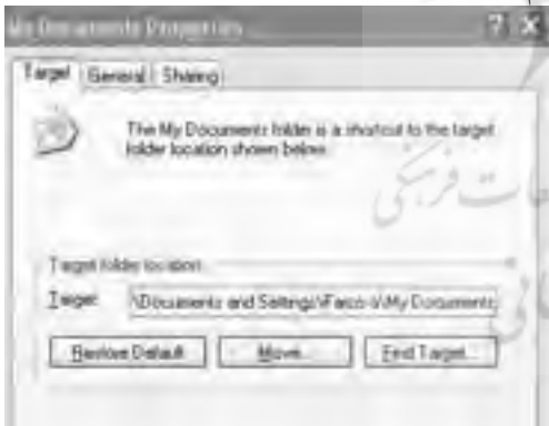
شکل ( ۱ )

این پوشه از مهمترین پوشه های کامپیوتر می باشد ، چون به طور پیش فرض ، اکثر برنامه ها در هنگام ذخیره فایلها ، در این پوشه ذخیره شود و همچنین پوشه های my pictures و my music که برنامه های نمایش عکس و مدییا پلیرها نیز در پوشه my documents ذخیره می گردد. چون این پوشه در پارتیشن C: و همانجایی که ویندوز نصب شده است. امکان دارد هنگام بروز مشکل برای ویندوز و نصب مجدد آن ، مجبور به فرمت format کردن این پارتیشن شویم و در نتیجه این پوشه را از دست بدهیم . بنابراین اگر فایل های خود را بیشتر در این پوشه ذخیره می کنید ، بهتر است آن را به پارتیشن دیگری منتقل نمایید . برای این کار از روش زیر استفاده می کنیم.