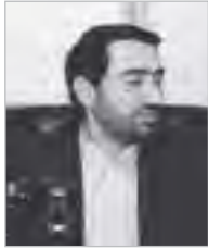
■ دکتر صحت: