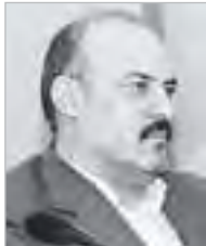
■ ضمیری :

تأسیس شرکت‌های بیمه خصوصی، اصلاح ساختار فعلی شرکت‌های بیمه دولتی، تجدید نظر در مقررات و قوانین بیمه‌ای که عموماً از قدمت بسیار طولانی برخوردار هستند و به روزرسانی آنها، اقداماتی است که می‌بایست در صنعت بیمه کشور انجام پذیرد