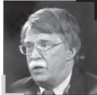
جان بولتون، معاون وزیر خارجه آمریکا

اسلامی و ایجاد انسجام ملی، تولید قدرت ملی و ایجاد توانایی برای پیگیری اهداف ملی و دفاع از منابع ملی، تقویت گفتمان بیداری اسلامی، افزایش قدرت نرم و بازیگری ایران در مناسبات منطقه‌ای و بین‌المللی، ایجاد بازدارندگی و ناممکن شدن اقدام نظامی علیه ایران» ۱۱