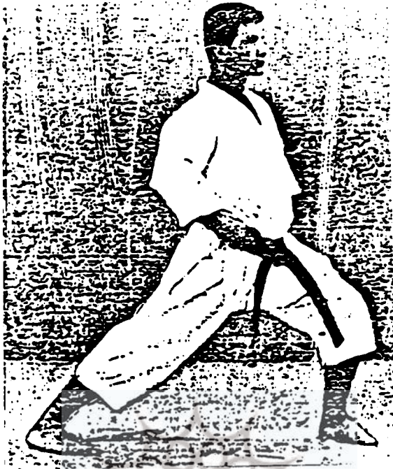
تکیه به جلو