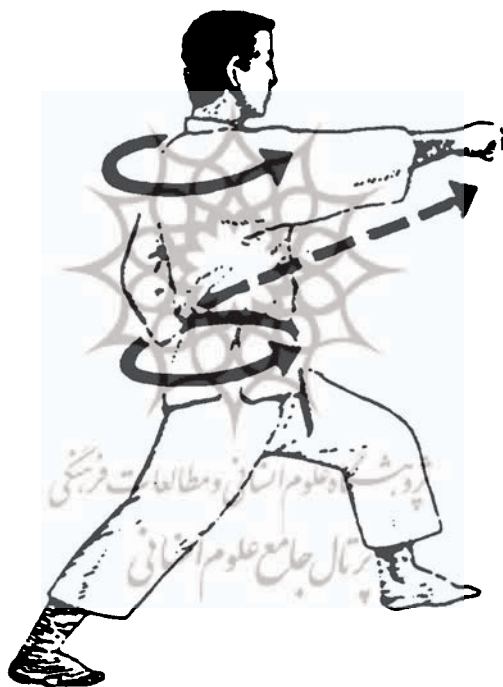
شکل ۱ - فن گیاکوزوکی

مرحله اول: در مرحله اول، از آزمودنی‌ها خواسته شد، فن گیاکوزوکی را با حداکثر سرعت و به شیوه و استایل مختص به خودشان یک بار از نیمه راه و بار دیگر از روی کمر اجرا کنند در این مرحله، قبل از گرفتن فیلم، آزمودنی باید ۱۰ دقیقه خود را گرم کرده، سپس برای اجرا چندین بار ضربه را تکرار نموده و هرگاه که اعلام آمادگی می‌کرد، فیلمبرداری انجام می‌شد. مرحله دوم: در این مرحله، سه روز قبل از اجرا، طی یک جلسه تمرینی، از آزمودنی‌ها خواسته شد که فن گیاکوزوکی را به شکل کاملاً کلاسیک اجرا کنند. در اجرای کلاسیک، ورزشکار باید به موارد زیر توجه داشته باشد: