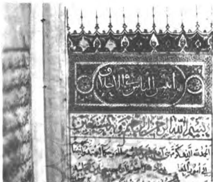
صفحه اول کتاب انیس الناس، نسخه خطی کتابخانه مجلس