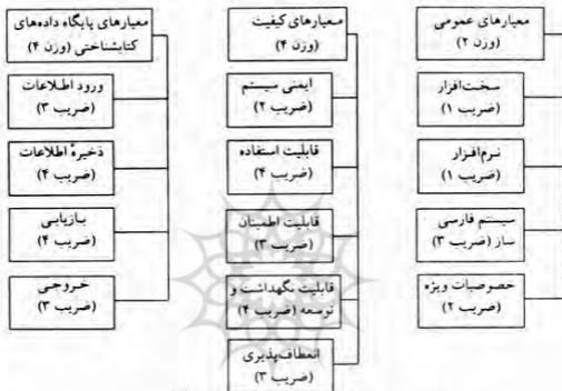
تصویر ۱. معیارهای سنجش و ضریب وزنی پیشنهادی

کتابخانه‌ای پرداختیم. در قسمت دوم معیارهای سنجش پایگاه داده‌های کتابشناختی را مد نظر داریم. روش مورد استفاده برای اندازه‌گیری میانگین حسابی وزنی است. لذا مجدداً نمودار کلی عوامل، معیارها، و مقدار ضریب وزنی پیشنهادی برای هر یک از آنها نشان داده می‌شود.