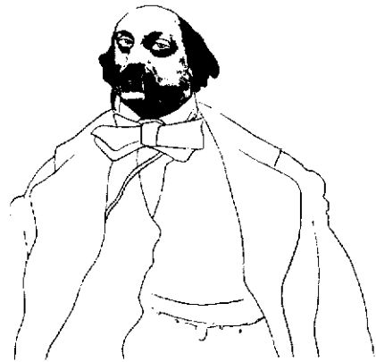
گوستاو فلوربر، طرحی از دیوید نوبل.

داستان رویارویی مردی جوان با زندگی، درس هایی که از تقدیر اجتماعی می گیرد، ناکامی اش در تجربیات عاشقانه و... قدرت این عنوان بی شک ناشی از جهان شمولی درون مایه و شاید هم فرم عبارت «تربیت احساسات» است.