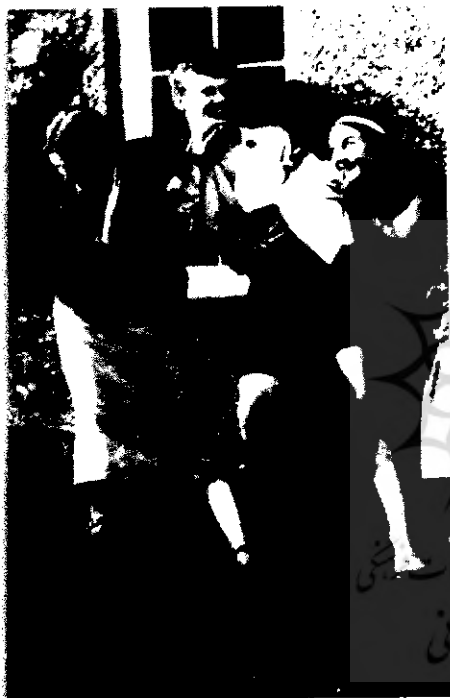
ویرجینیا و خواهرزاده هایش

وولف بسیار زیرکانه و با طنز و طعنه ای گزنده، فقط در چند جمله پیشنهاد انقلابی خود