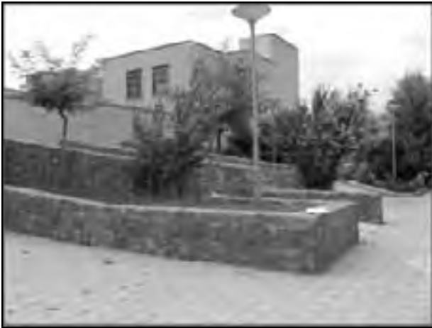
تصویر شماره ۴ - نمونه فضای باز در واحد همسایگی، ماخذ: نگارنده، ۱۳۸۵