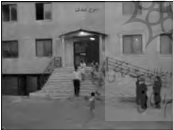
تصویر شماره ۵: فضای جلوی برج صدف

در مقیاس خرد تنها در جلوی برخی مجتمع‌های بزرگ مسکونی به عنوان نمونه برج صدف با کمی فرورفتگی و تعریف ورودی برج با پله، فضای نیمه خصوصی برای ساکنین آن ایجاد شده که گاهی برای نشستن مورد استفاده ساکنین آن قرار می‌گیرد.