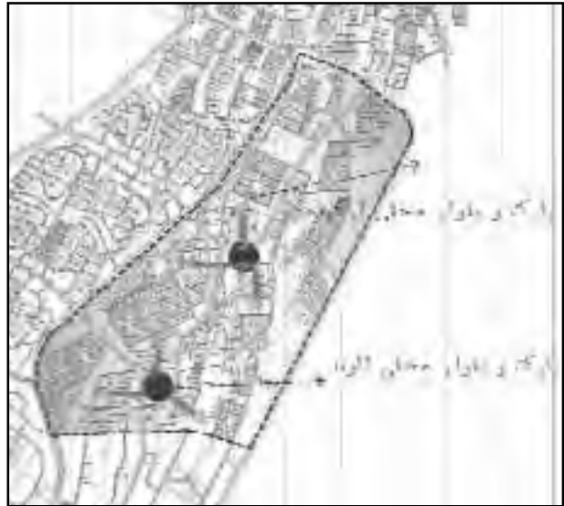
تصویر شماره ۳: موقعیت مرکز محلات در نظر گرفته شده توسط مشاور در فاز ۱ شهر جدید هشتگرد

در مقیاس خرد تنها در جلوی برخی مجتمع‌های بزرگ مسکونی به عنوان نمونه برج صدف با کمی فرورفتگی و تعریف ورودی برج با پله، فضای نیمه خصوصی برای ساکنین آن ایجاد شده که گاهی برای نشستن مورد استفاده ساکنین آن قرار می‌گیرد.