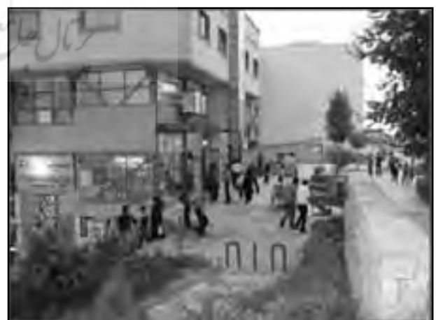
تصاویر شماره (۶، ۷ و ۸) - بلوار تجاری ارکیده و پارک منتهی به آن،