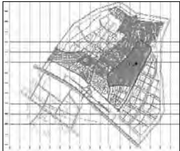
تصویر شماره ۲: نقشه کاربری شهر جدید هشتگرد

۴- مرکز محلات همان شاخه‌های تجاری است که به مرکز ناحیه منتهی می‌شود. و مشاور طرح مراکز محلات و ناحیه‌ها را جزء فضای شهری شهر جدید هشتگرد عنوان نمود.