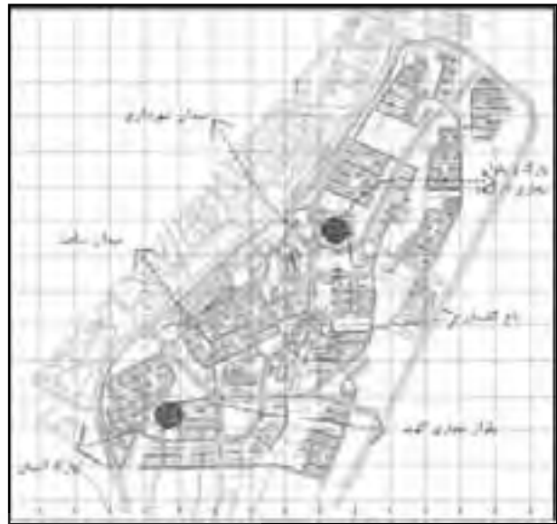
تصویر شماره ۹: مکانهای تجمع مردم در فاز ۱ شهر جدید هشتگرد

گردید حداکثر تا ۳ روز پرسشنامه ها را پر نموده و تحویل دهند. به منظور بالا بردن ضریب برگشت پرسشنامه ها، ۶ آپارتمان در هر بخش انتخاب و حداکثر ۶ پرسشنامه به هر آپارتمان داده شد. لازم به ذکر است که انتخاب آپارتمانها به روش نمونه گیری تصادفی تعیین گردید.