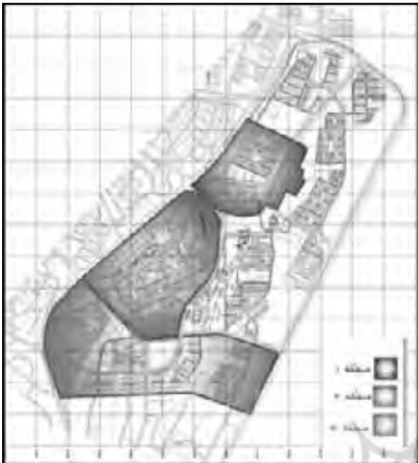
تصویر شماره (۱۰): موقعیت بخشهای توزیع پرسشنامه ها در فاز ۱ شهر جدید هشتگرد