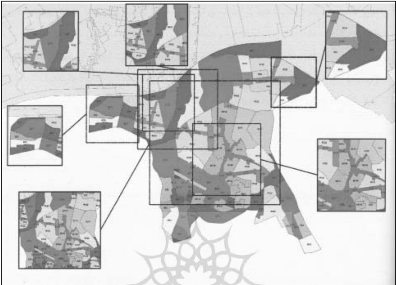
نقشه زیربهنه‌های منطقه ۲۰ تهران