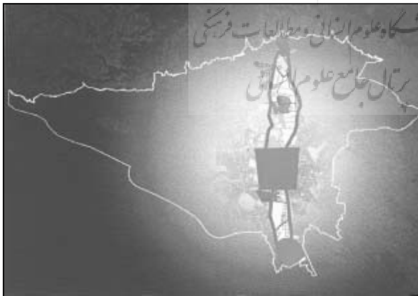
جایگاه منطقه ۲۰ در محور تاریخ - مذهبی شهر تهران

تهیه گردیده، مشاور ملزم است طرح‌ها را در این مقیاس تهیه و جهت اجرا در اختیار مناطق قرار دهد.