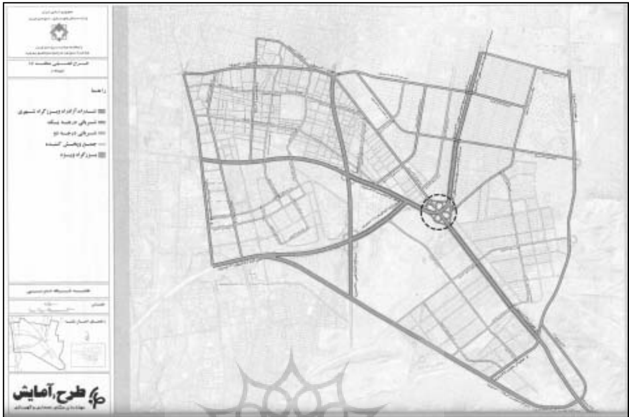
نقشه معابر پیشنهادی در طرح تفصیلی منطقه ۱۵ شهرداری تهران (۱۳۸۵)