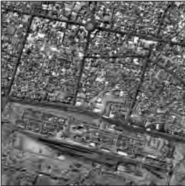
عکس ماهواره ای زنجان