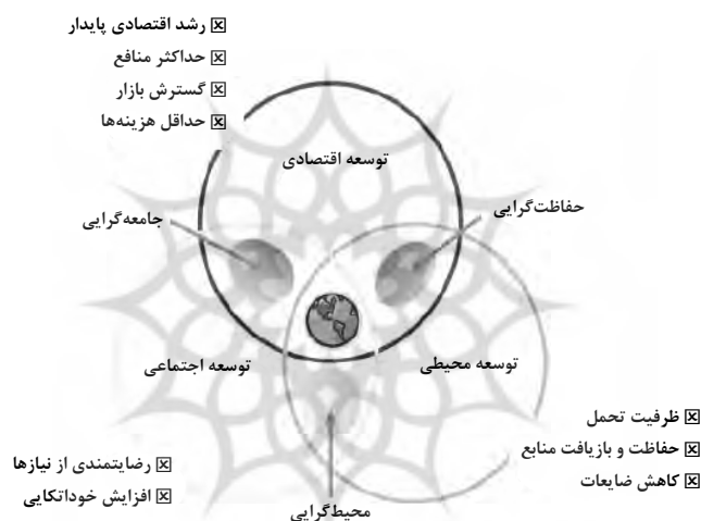
شکل ۲. رویکردها و معیارهای تبیین‌کننده توسعه پایدار

حفاظت‌گرایی، محیط‌گرایی و جامعه‌گرایی شکل گرفته‌اند. در توسعه اقتصادی هدف غایی تأمین رشد اقتصادی پایدار، به حداکثر رساندن منافع، گسترش بازار، حداقل ساختن هزینه‌ها، در توسعه محیطی تأمین ظرفیت تحمل منابع، حفاظت و بازیافت منابع، کاهش ضایعات و در توسعه اجتماعی رضایتمندی از نیازها و افزایش خوداتکایی معنا یافته‌اند (Rodrigue, 2009, 2).