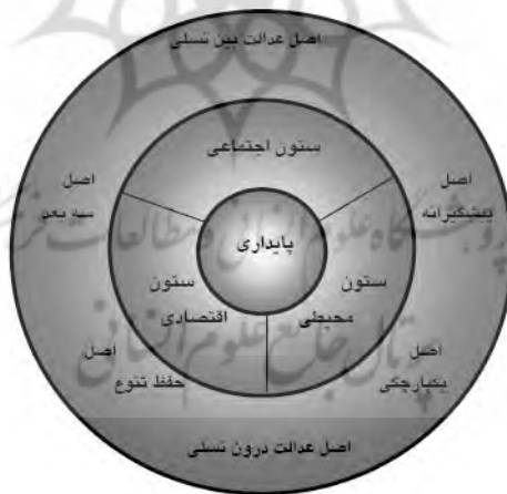
شکل ۵. ستون‌ها و اصول توسعه پایدار

توسعه پایدار، همان‌طور که شکل ۵ نشان می‌دهد، دارای ۶ اصل عمومی است. نخستین اصل بر ابعاد سه‌گانه اقتصادی و اجتماعی و محیطی به عنوان ستون‌های پایداری تأکید دارد.