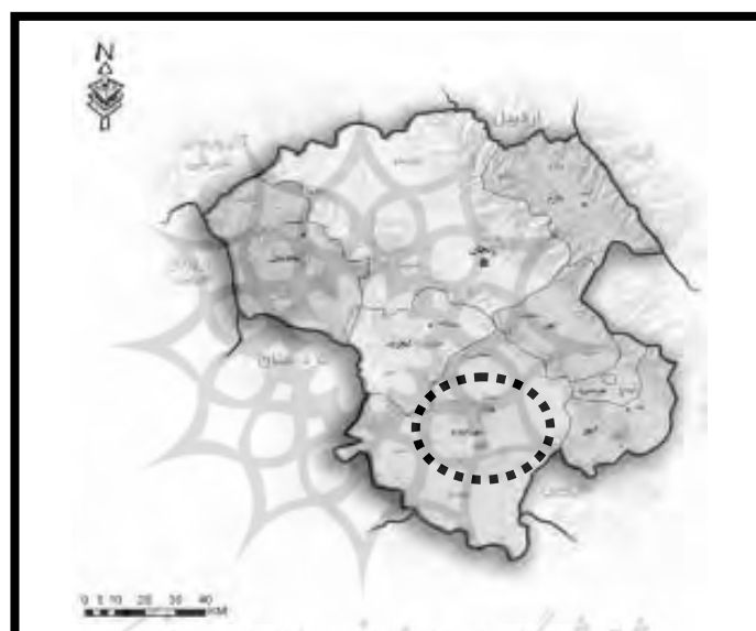
شکل ۸. موقعیت جغرافیایی منطقه مورد مطالعه

همان طور که اشاره شد، ملاک و معیار سنجش سطح پایداری همان شاخص‌ها هستند که می‌توانند ابزاری مفید برای نظارت و کنترل روندها ارائه کنند و تغییرات را به‌خوبی منعکس سازند (Kackar, 1999, 3).