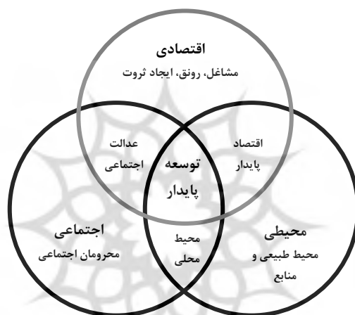
شکل ۷. مؤلفه‌های مورد تأکید در توسعه پایدار

گروه‌های دیگر فراهم می‌کنند. بدین ترتیب در مبحث اجتماعی توسعه پایدار تأکید بر رفع بی‌عدالتی و بی‌تعادلی در سطح جوامع مورد توجه است. در توسعه پایدار با رویکرد اجتماعی دو مفهوم مشارکت و توانمندسازی جایگاه ویژه‌ای دارند (Overton, 1999, 7-8). گروهی نیز معتقدند که پایداری اجتماعی دربرگیرنده برابری، تأمین خدمات اجتماعی نظیر آموزش و بهداشت، برابری جنسیتی، پاسخگویی سیاسی و مشارکت اجتماعی است (Harris, 2000, 6).