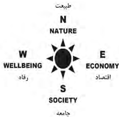
شکل ۴. جهت‌یاب پایداری

توسعه پایدار، همان‌طور که شکل ۵ نشان می‌دهد، دارای ۶ اصل عمومی است. نخستین اصل بر ابعاد سه‌گانه اقتصادی و اجتماعی و محیطی به عنوان ستون‌های پایداری تأکید دارد.