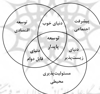
شکل ۱. ابعاد و مؤلفه‌های اصلی توسعه پایدار

مستمر، زندگی مطمئن، امنیت غذایی، عدالت و ثبات اجتماعی و مشارکت مردم را تسهیل می‌کند. در فرایند توسعه پایدار، اهداف اجتماعی و اقتصادی و محیطی جامعه در هر جا که ممکن است از طریق وضع سیاست‌ها، انجام اقدامات لازم و عملیات حمایتی با هم تلفیق می‌شوند (زاهدی و نجفی، ۱۳۸۵، ۲۱). همان‌طور که شکل ۱ نشان می‌دهد، توسعه پایدار بر آن است تا از طریق توسعه اقتصادی، پیشرفت اجتماعی و مسئولیت‌پذیری محیطی جامعه انسانی را به سوی دنیایی خوب، زیست‌پذیر و دوام‌یافتنی رهنمون سازد. در این معنا، هسته مرکزی مفهوم پایداری بر حفظ و نگاهداشت «ذخایر سرمایه‌ای» استوار است و در حقیقت توسعه پایدار چیزی جز حفظ ذخایر سرمایه‌ای چون سرمایه انسانی، اجتماعی، طبیعی و اقتصادی نیست.