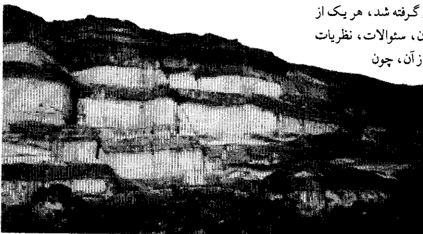
گسل هادی - اسلکه ماهیگیری پزم - چابهار