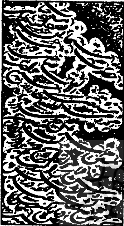
نمونه خوشنویسی میرزا غلامرضا اصفهانی

در نیمه اول قرن سیزدهم و تلاش او در چند دهه با بهره گیری از مکتب درویش، گرچه از خاطره ها دور مانده، ولی با نمونه هایی که در دست می باشد و اخیراً با مشاهده مرقعی بسیار نفیس در کتابخانه مجلس، دیده شد که در صفحه پردازی آثار خارق العاده ای خلق کرده است. در پایان قرن سیزدهم و اوایل قرن چهاردهم با چهره شاخص و برجسته ای به نام میرزا غلامرضا اصفهانی روبرو می شویم. ستاره درخشان قلم نستعلیق که از او آثار ارزشمندی به صورت قطعات ناب و سیاه مشقهایی که در اوج شناخت صفحه و ترکیب بندی در اقلام خفی و جلی است، باقی مانده است. هنرمندی که آثار او تمام قابلیت های فنی و هنری خوشنویسی را یکجا دارا بود. تعالی روح این بزرگوار تا بدانجا رسید که فریفته خط درویش گردید و بدان سرسپرده شد. بالاخص که همان نرمش، دور، شیرینی و ترکیب بندی هائی را که در شناخت فضاهاى جادوئی