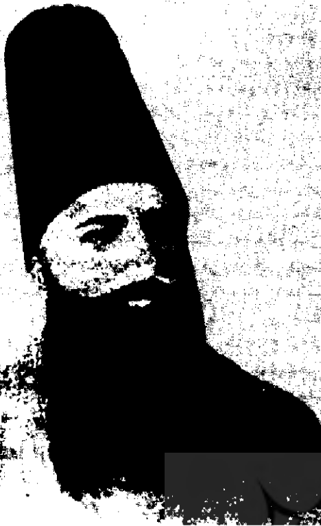
قائم مقام فراهانی