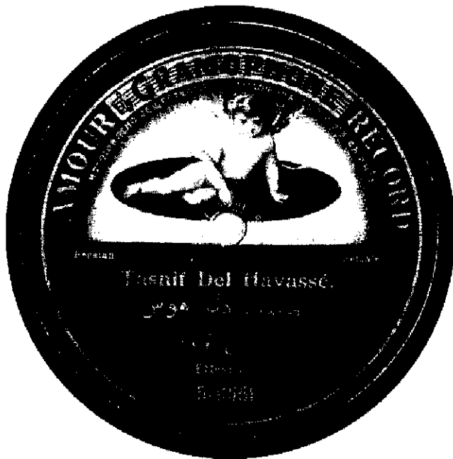
برجسب صفحه دل هوس