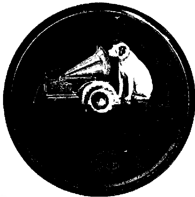
برچسب صفحه‌ای دست حق

هیز ماسترزوویس (HMV) ضبط شده است. در روزگاران بعد، استاد غلامحسین بنان یک بار در سال ۱۳۲۶ ش. با رکستر ابراهیم خان منصوری در صفحه شماره (OHB-۱۱۳۶-۳۷RR.۲۸) و بار دیگر در سال ۱۳۳۶ ش. با رکستر رادیو و تنظیم روح الله خالقی، آن را در گلهای رنگارنگ شماره ۲۴۹ اجرا کرده است. اجرای دیگری از این اثر با صدای اقبال آذر در دسترس می باشد.