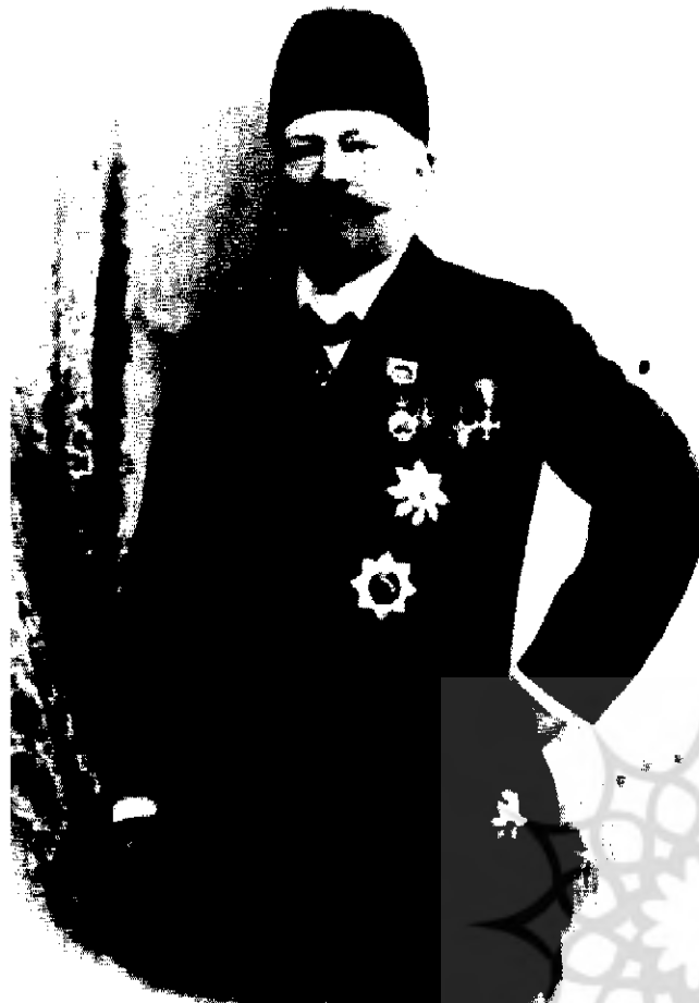
مسیو نوز بلژیکی