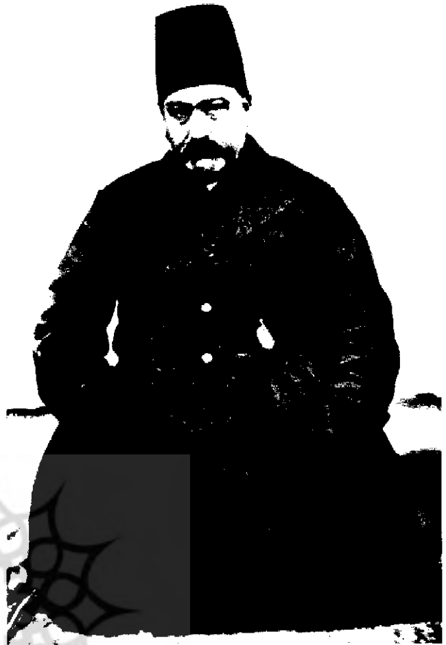
صنایع الدوله (اعتماد السلطنه)

اینکه با سبیل تلگرافهای داخلی در حمایت از خواستهای مشروطه خواهان روبرو شد و همچنین تلگرافهای رسیده از باکو و تفلیس را مبنی بر آمادگی برای اعزام نیروهای مبارز مسلح مشاهده کرد، سرانجام تسلیم شد و مظفردالدین شاه، سه هفته پس از تحصن متعرضان در سفارت انگلیس، مشیرالدوله را به نخست وزیری برگزید (۲۱) و در روز چهاردهم مرداد ۱۲۸۵ ش. برابر با بیست و دوم مارس ۱۹۰۶ م. فرمان حکومت مشروطه را امضا و صادر کرد. (۲۲)