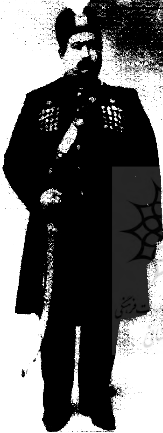
محمد علی شاه

برخاستند که اصناف و تجار بخش عمده آن بودند، و همین امر سبب شد تا ضمن آنکه اصناف نقش تاریخی-اجتماعی خود را بازیابند، به عنوان بازیگران اصلی صحنه، مبارزه ای سیاسی، اقتصادی و اجتماعی آغاز کنند و این امر آنچنان اهمیت پیدا کرد که حتی طبقه حاکمه و دیوانسالاری بر آن مهر تأیید زد و جایگاهی خاص برای آنها در ساختار جدید سیاسی حکومت - که حاصل انقلاب خود آنها بود - قائل شد.