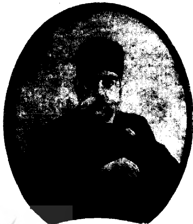
مظفر الدین شاه

خود واقف شدند و از اولین تماسهای تحصیلی و دیپلماتیک با نظام سیاسی غرب، تفاوتها را حس کردند.