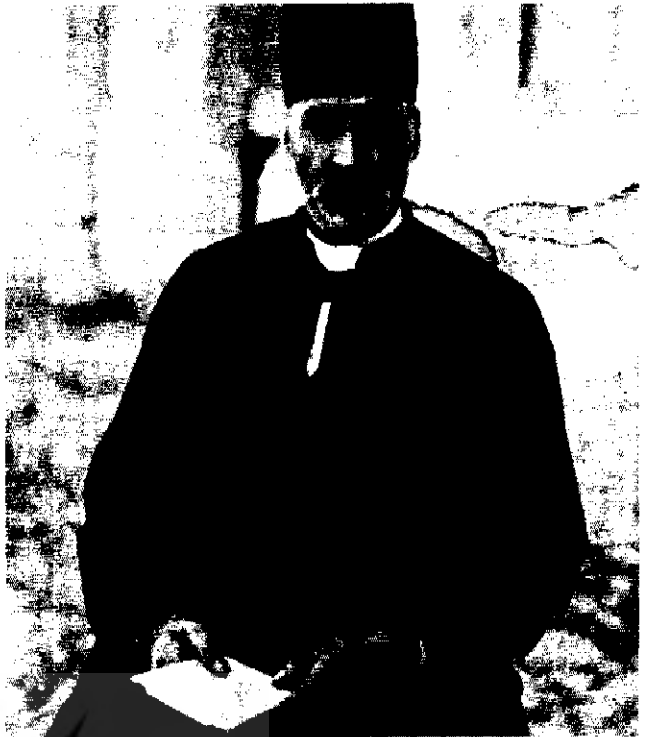
میرزا نصرالله خان مشیرالدوله نائینی

در این میان رفتار توهین آمیز حکام با بعضی از علما، موجب شکاف بیش تری بین دربار و مردم گردید. در شیراز مشاجره آشکاری به رهبری علما میان شعاع السلطنه حاکم شهر و مردم در گرفت. (۱۵)