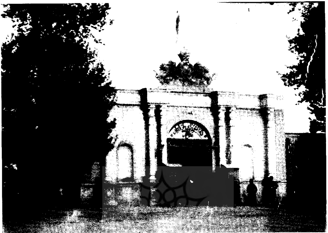
عمارت بهارستان پس از نقل مکان مجلس شورای ملی