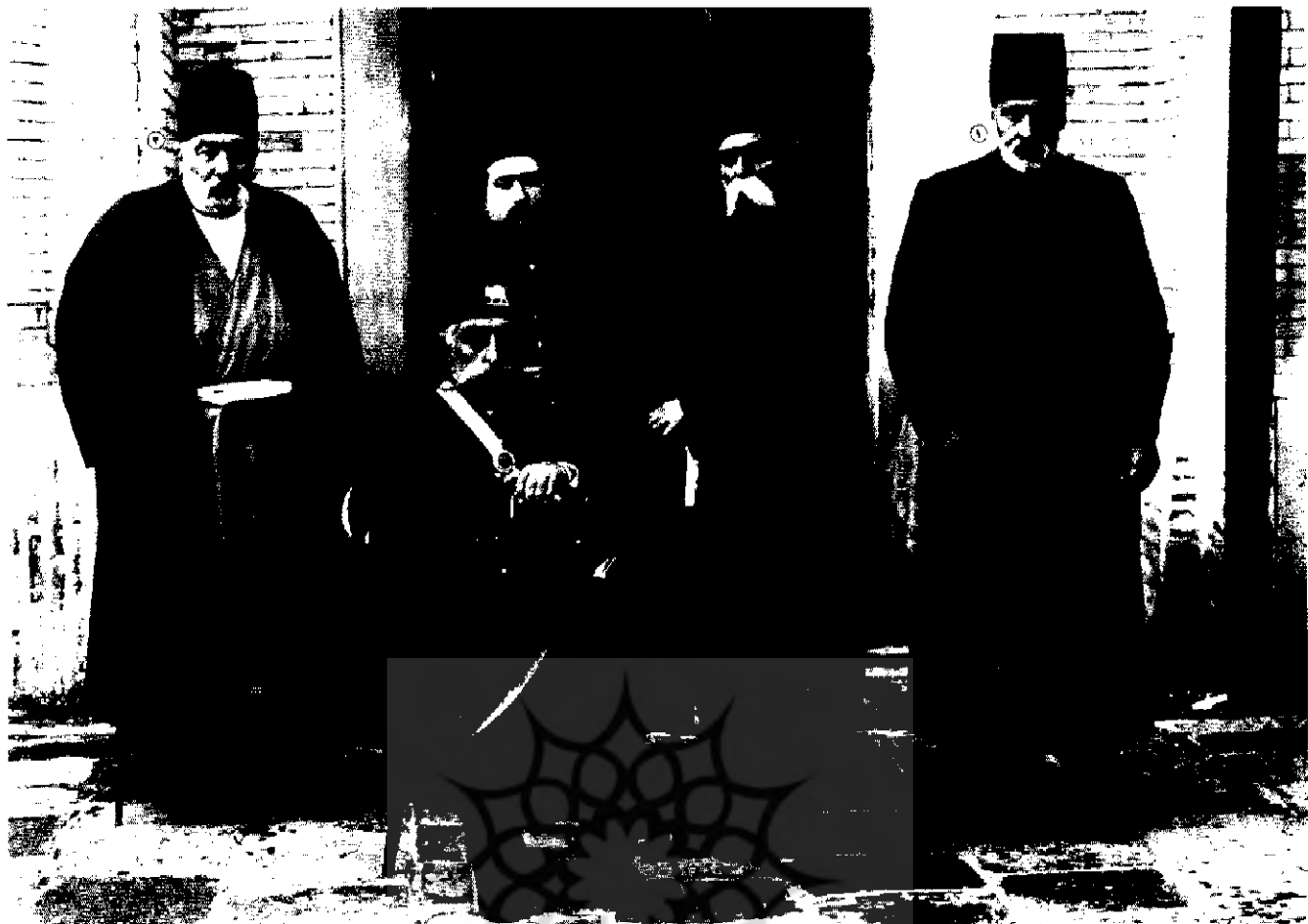
مظفرالدین شاه در میان چندتن از رجال سیاسی خود میرزا نصرالله خان مشیرالدوله - عبدالمجید میرزا عین الدوله - محمدعلی میرزا ولیعهد - میرزا احمدخان مشیرالسلطنه

صنیع الدوله (۲) به ریاست و میرزا حسن خان وثوق الدوله و حاج محمدحسین امین الضرب به نیابت انتخاب شدند.