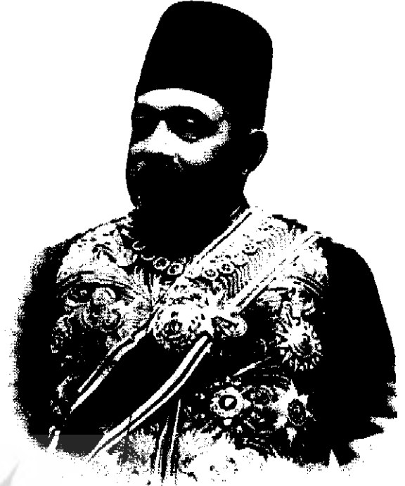
علی اصغر خان امین السلطان (اتابک اعظم)