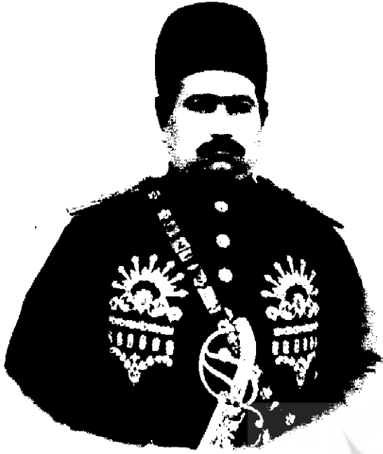
محمد علی شاہ