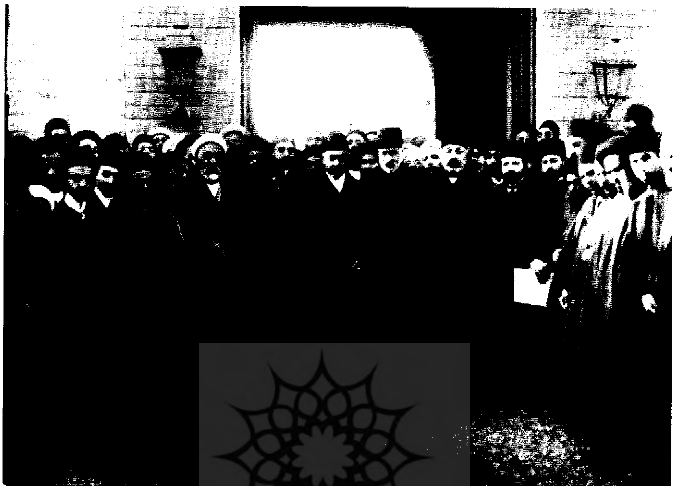
صدراعظم، وزرا و تجار هنگام آوردن دستخط مشروطیت به مجلس

نمایی مجلس در مقابل شاه بود. رد قرارداد ۱۹۰۷ در مجلس و عزل مسعود میرزا ظل السلطان از حکومت اصفهان، برکناری قوام الملک از شیراز، آصف الدوله از خراسان، فیروز میرزا از کرمان و چند نفر دیگر، از خواسته های مجلسیان بود.