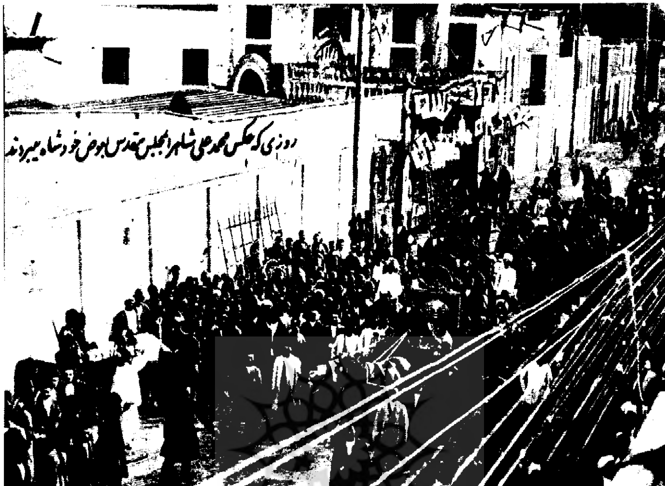
روزی که به جای محمدعلی شاه، تصویر او را به مجلس بردند.

بوده با مشروطه مشروعه موافقت داشت. در زمان حیات، در خیابان مولوی مسجد و مدرسه ای بنا کرده که هم اکنون باقی است. ۷- ابو القاسم غره گوزلو، تحصیلکرده انگلستان و از مالکان بزرگ همدان بود. مشروطه را برای ایران زود می دانست. بیش تر عمر خود را در لندن گذرانید و دوستان موفری در آن کشور داشت. از نظر دیپلماتی، از طرفداران سیاست انگلیس در ایران بود. ناصر الملک، با حمایت کامل دولت انگلستان مدت چهار سال نایب السلطنه ایران شد و پادیکتاتوری کامل، ایران را به سوی بدبختی سوق داد. در اواخر عمر به تهران آمد و در ۱۳۰۶ش. درگذشت.