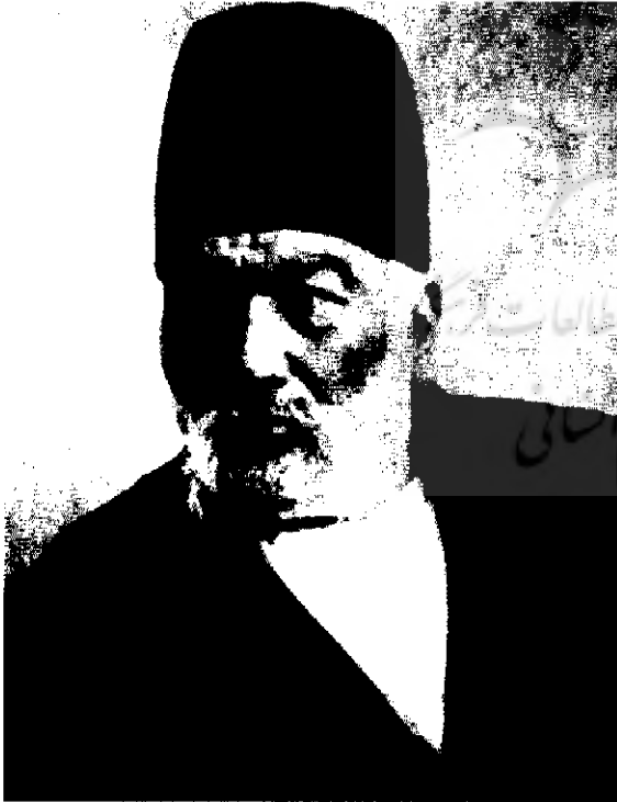
میرزا احمد خان مشیر السلطنہ