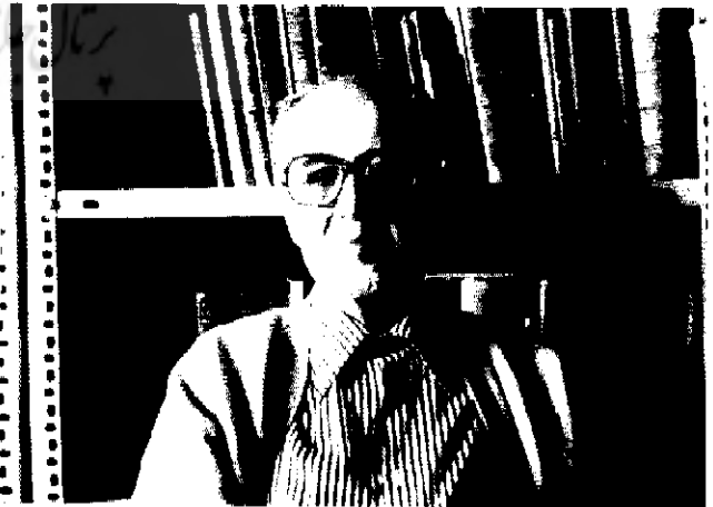
مرحوم دکتر جواد مشکور (مورخ)

۱۲- تاریخ شفاهی (اروگونه) در دانشگاه جمهوری در مونت ویدئو