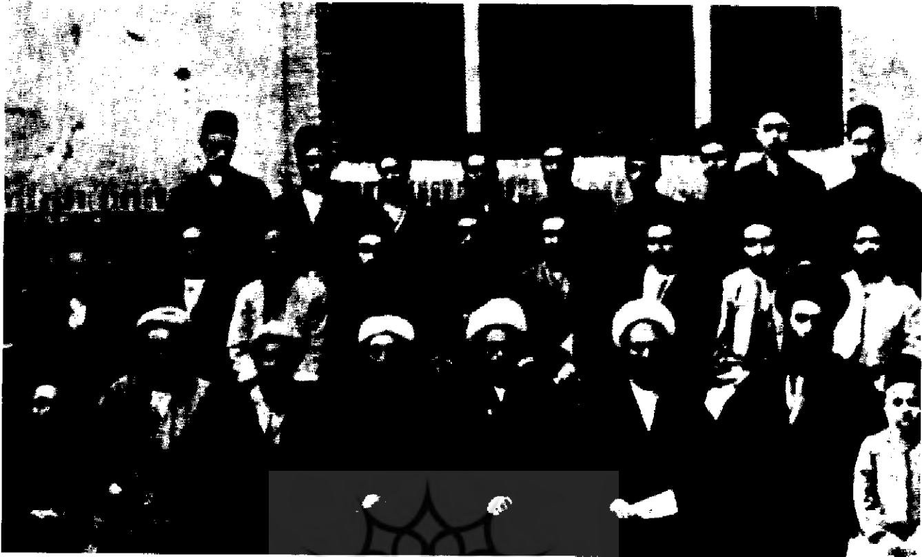
خیابانی در میان جمعی از همفکران خویش