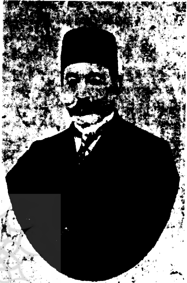
مخبر السلطنة (سرکوبگر قیام خیابانی)

نمی تواند در یک روز خود را از اثرات شوم زندگی سابق نجات دهد. در نتیجه، انقلاباتی است که شما امروز دارای معلومات و عقاید جدید شده اید؛ ولی چون به درجه کمال نرسیده اید، شما را نباید خود دسر گذاشت. باید شما را تغییر شکل داد. یک ملت زنده، فکور و متحد بار آورد. حکما گفته اند: تمدن، اساس عبارت از این است که عادات قدیمی و رسوم کهنه، بتدریج محو گشته، دستورهای تازه و نو، جانشین آنها شود. ما، این دستورهای تازه را به شما یاد خواهیم داد و این قیام، به این وظیفه خود عمل خواهد کرد. شخصی که در تاریکی زیست کرده است، در پیش یک روشنائی، آبی چشمش خیره و یا کور می شود.» (۲۴)