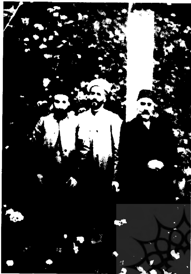
خیابانی و همفکران

است، دیگر عزم و اراده ما، با سهولت به اجرای آن تکلیف تعلق می گیرد؛ و هرگاه تعلق و وزیم و ما به کلی تکلیف خود را ترک گوئیم، اضطراب درونی و یک ناهنجاری وجدانی در ما حاصل می گردد.