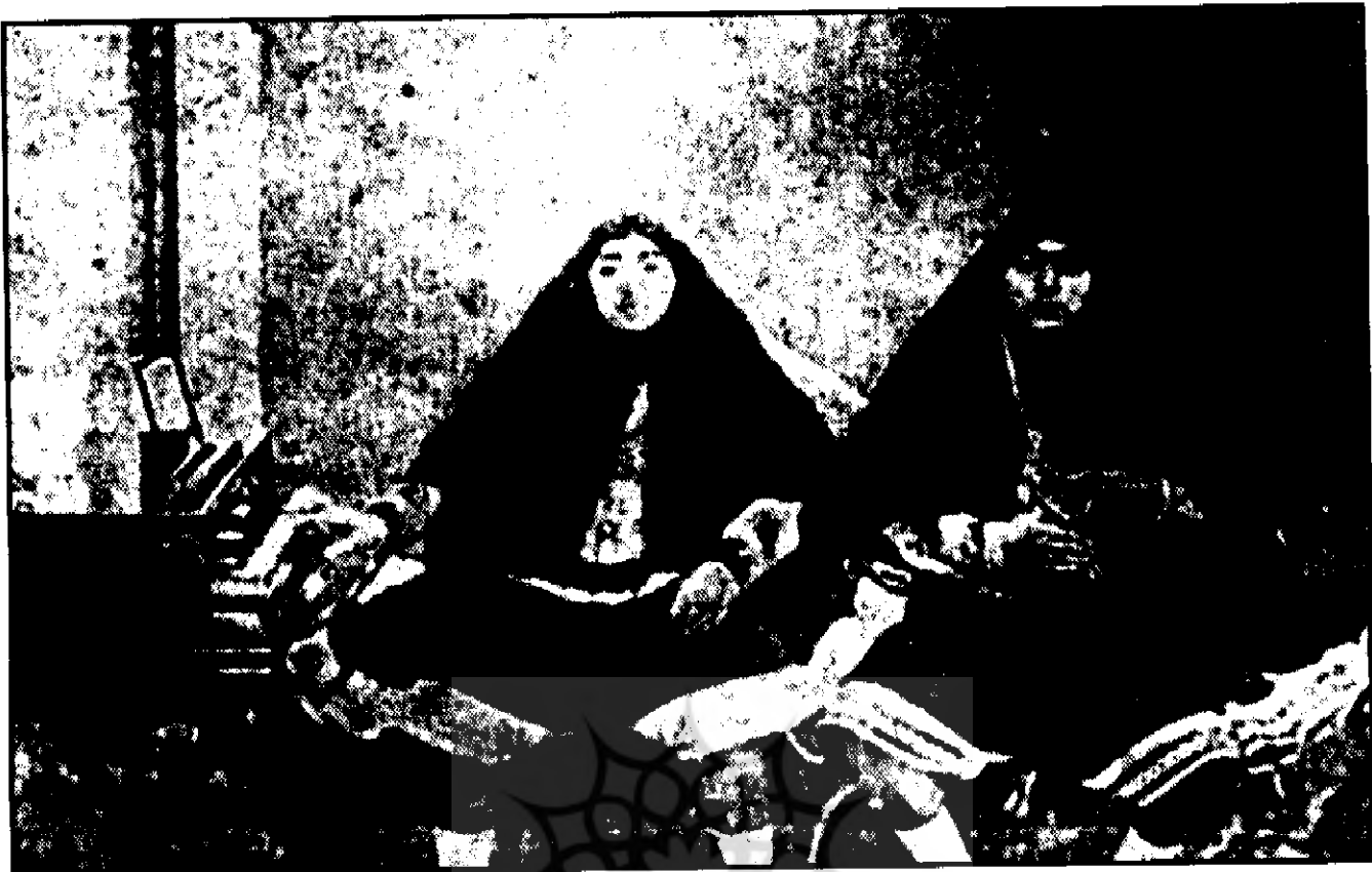
از راست به چپ تومان آغا فخرالدوله و توران آغا فروغ الدوله دختران ناصرالدین شاه و زنان مجدالدوله و ظهیرالدوله

شهرستانک به تو چال می رفت چنین می نویسد: