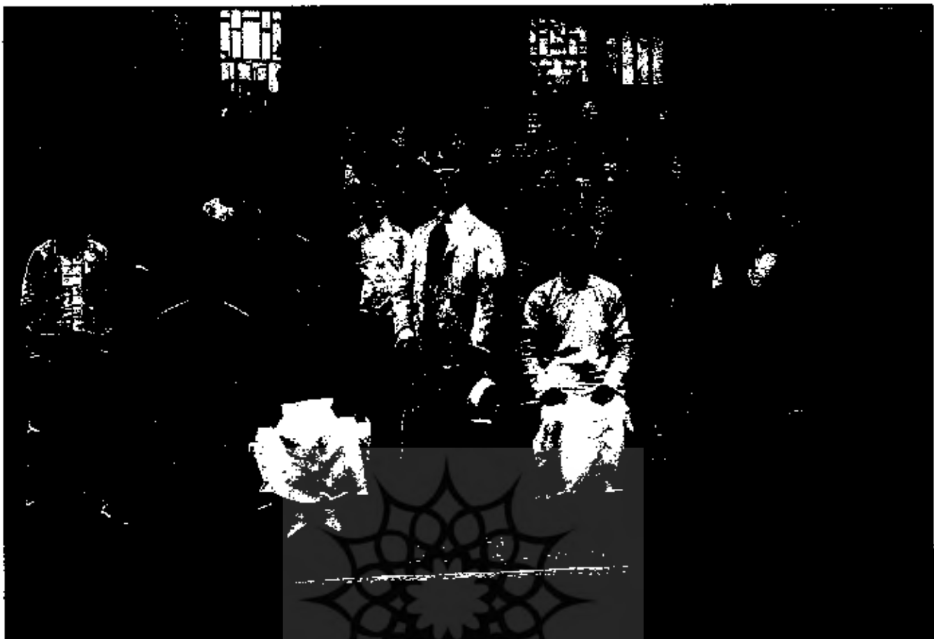
یکی از رابطین تجاری مصطفی کمال در چین

آن به عنوان عالی‌ترین مدارج ترقی قالی کرمان یاد کرده، با تاریخ هجری شمس ۱۹۲۲ تا ۱۹۲۹ میلادی برابر با ۱۳۰۱ تا ۱۳۰۸ شمسی، درمی‌یابیم که وی درست زمانی را دوران تعالی قالی کرمان دانسته که کارگاه‌های قالیبافی مصطفی کمال، در شهر کرمان، تولیدات مرغوب خود را در عدل بندی های انبوه، به وسیله شریه بند عباسی و از آنجا از طریق کشتی، روانه بندر نیویورک در کشور آمریکا می‌ساخته است؛ که همین تجارت انبوه و صادرات بی‌وقفه فرشهای مصطفی کمال به خارج از کشور، بالاخص آمریکا بود که موجب گردید در همین زمان یا در آغاز قرن بیستم، قالی کرمان را سراسر جهان آن روز بشناسند و کرمان یکی از بزرگترین مراکز قالیبافی جهان نام بگیرد (۳)».