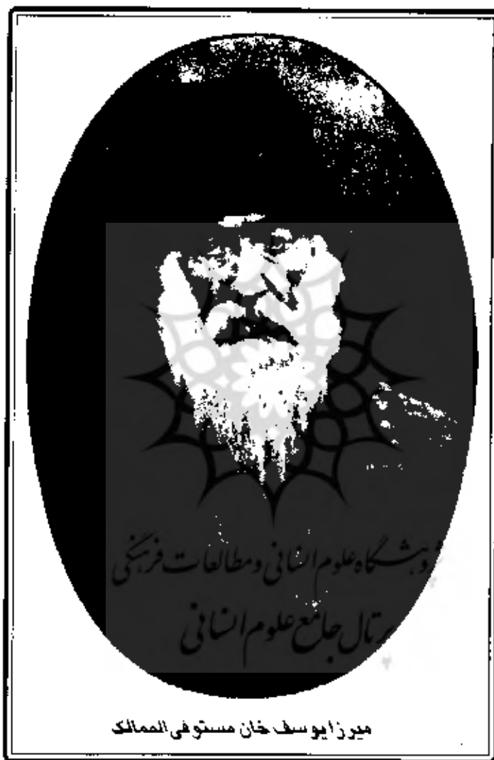
میرزا یوسف خان مستوفی الممالک

حرف و کل امور مملکت ایران مسئولیت تکالیف آن مجتم و محسن