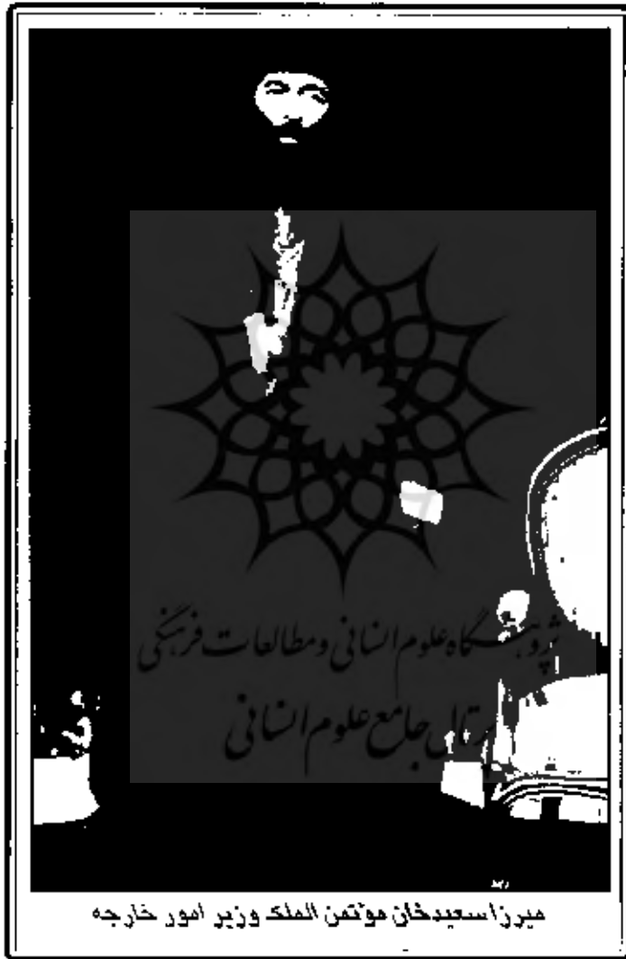
میرزا سعیدخان موتمن الملک وزیر امور خارجه

ملاحظه شد را بنویسند به نظر برسد، مامی موسم صحیح است به مهر برسد مهر کنند. پست فرامین بر روات همین مهر صحیح دربار اعظم و ملاحظه شد به خط و زوای مختار باید باشد. تا او باشد به مهر مانسباید برسد. مهر باید برسد عهد الملک باشد.